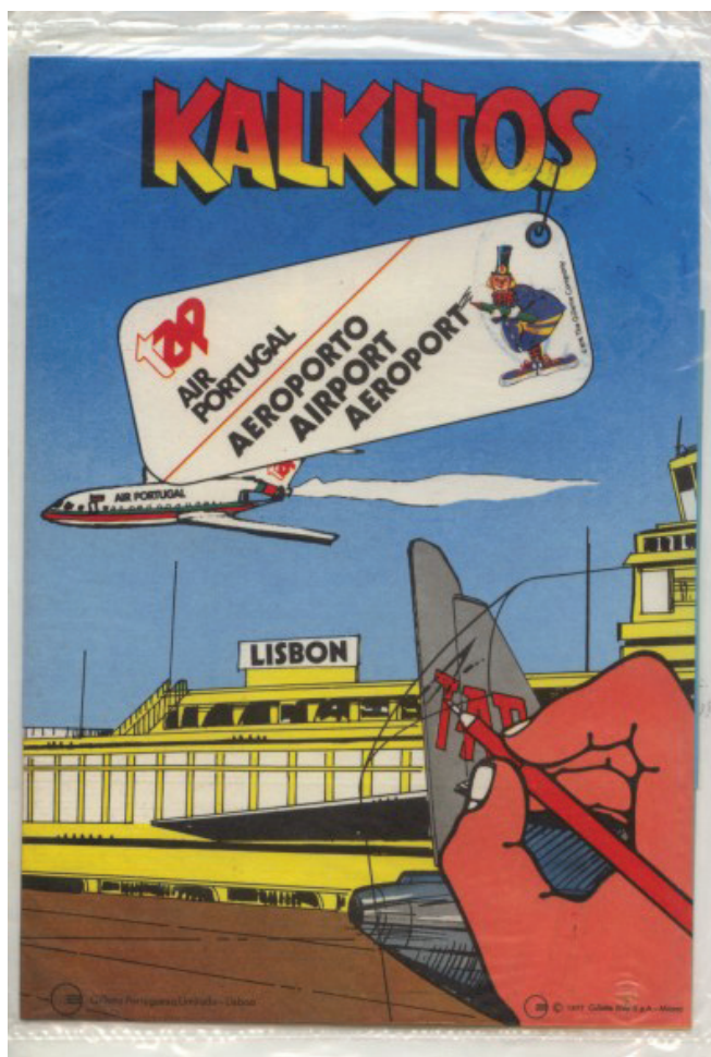
Fig. 11 Kalkitos customizado para a TAP (década de oitenta). Museu TAP.

Selecione um objecto pela sua originalidade e destaque que alcançou durante a sua vida como giveaway. Ninguém que pertença à geração baby boomer terá esquecido os Kalkitos. Tratava-se de cartolinas com paisagens ou recriações de diversos ambientes que podiam ser personalizados através de figuras decalcadas. Muitos os terão coleccionado e ainda os possuirão algures guardados nos seus baús de recordações. Alguns, ou a maioria, desconhecem que a TAP também produziu e personalizou um destes Kalkitos, nunca comercializado, o qual apresenta o ambiente da placa do aeroporto de Lisboa com aviões da TAP Air Portugal (logo de 1979) (Fig. 11).