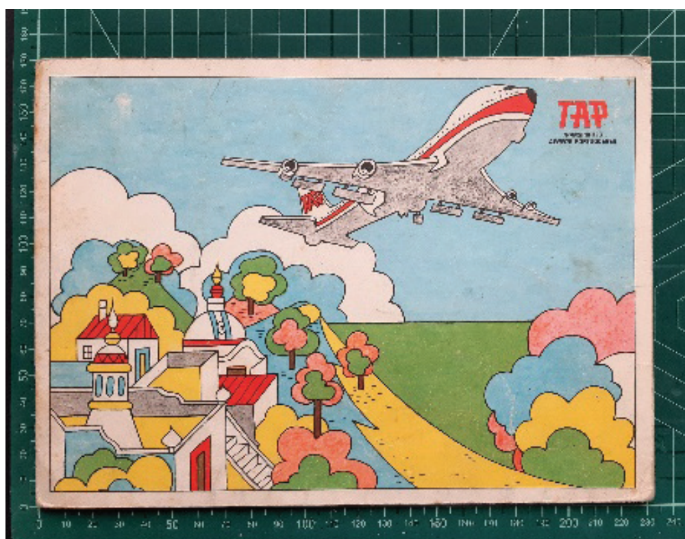
Fig. 6 Livro para colorir TAP (início da década de setenta). Colecção do autor.

Na década de oitenta os livros para colorir encontraram substituto sob a forma de uma pequena prancheta de desenho reutilizável, denominada “Magic Board” (Fig. 7). Reproduzindo o formato das antigas ardósias escolares, permitia desenhar por meio de um estilete e apagar por deslizamento.