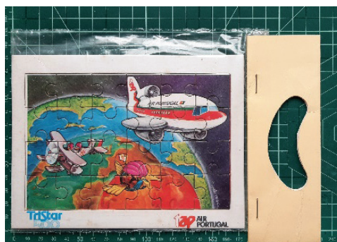
Fig. 8 Puzzle em cartolina alusivo ao Boeing 747 da (década de setenta). Museu TAP.