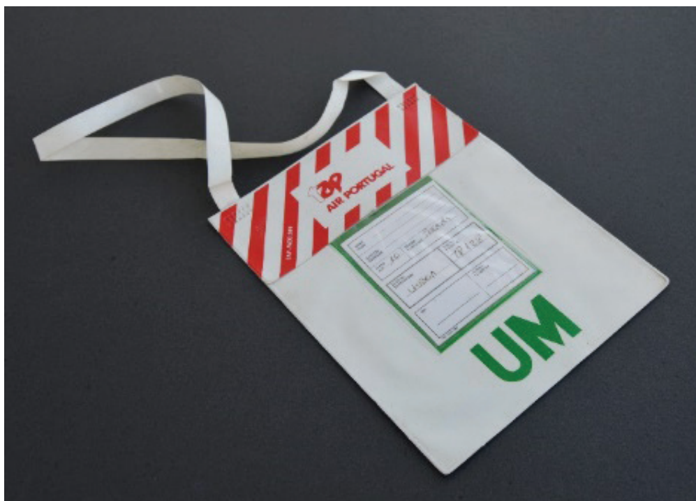
Fig. 1 Modelo Bolsa TAP em vinil para identificação de menores não acompanhados (década de 80). Colecção do autor.

O modo para captar a atenção das crianças e mantê-las concentradas e ocupadas centrou-se à época na distribuição de passatempos e jogos didácticos. Os livros e lápis de cor foram quase obrigatórios ao longo de várias décadas (Figs. 2 e 3). Apesar da qualidade muito duvidosa da grafite, o logótipo da companhia de aviação neles gravado, foi usado e exibido orgulhosamente junto dos colegas de escola ou grupo de amigos, como objecto de status (Baudrillard, 1995), confirmando o seu “baptismo do ar”. Embora em processo de redução de tarifas, devido ao aumento da lotação dos aviões a jacto, a viagem aérea, sobretudo em Portugal, ainda tinha preços elevados para a classe média. Portanto, ainda poucos o faziam. Confirmando esse status foram igualmente distribuídos “diários de bordo” ou “diários de voo”, nos quais se podia registar a data, a rota e o tipo de avião, autenticados com a assinatura do comandante (Fig. 4).