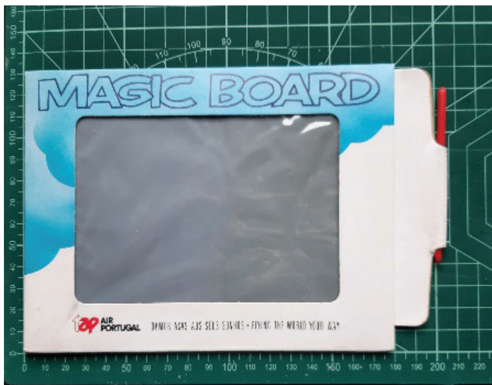
Fig. 7 Prancheta de desenho “Magic Board” (década de oitenta). Colecção do autor

Na década de oitenta os livros para colorir encontraram substituto sob a forma de uma pequena prancheta de desenho reutilizável, denominada “Magic Board” (Fig. 7). Reproduzindo o formato das antigas ardósias escolares, permitia desenhar por meio de um estilete e apagar por deslizamento.