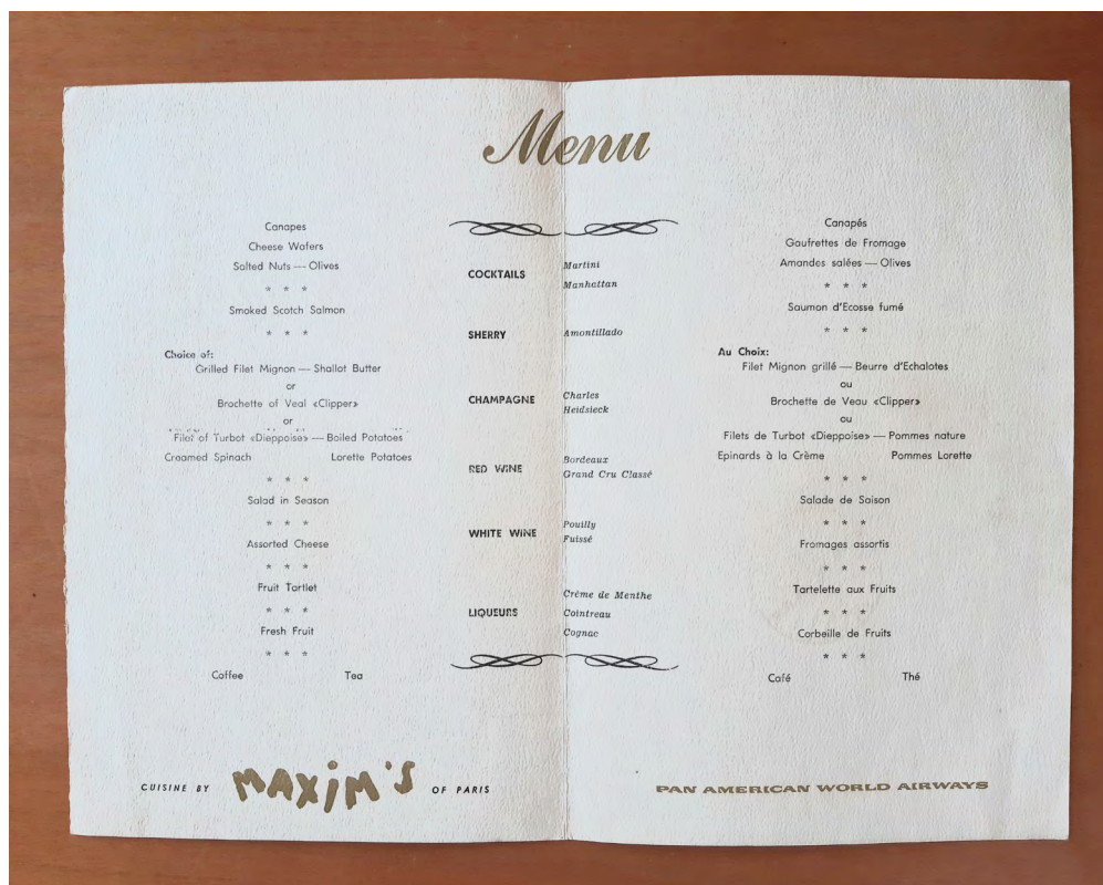
Fig.1 Menu da Classe “The President” com refeições confeccionadas pelo chef do restaurante de luxo Maxim’s em Paris

Contrariamente ao que se possa supor, não foi o serviço de Primeira Classe a emergir como factor distintivo, mas o oposto. O gradual aumento do número de lugares disponíveis tornou possível introduzir tarifas económicas e consequentemente menos luxuosas 11 . A segmentação da viagem aérea, acessível a um número cada vez mais vasto de rendimentos, resultou na partilha do mesmo espaço por diversos estratos sociais (Classe Económica, Primeira Classe, mais tarde a Classe Executiva).