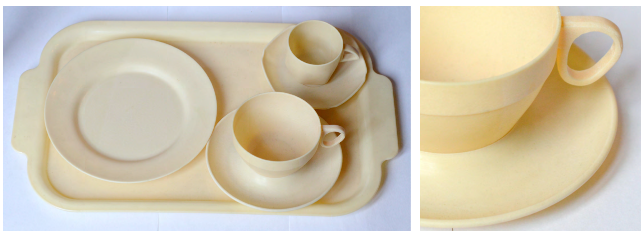
Fig. 3a e 3b

Sensivelmente deste período, encontrámos na Fundação Medeiros e Almeida um conjunto único de peças da Aero-Portuguesa (1934-1953), uma menos conhecida companhia pioneira, da qual o empresário foi accionista. Preservam-se aí um conjunto composto por bandeja, prato, e dois conjuntos de chávena / pires para chá e café, fabricados em melamina e semelhantes aos exemplares da TAP (figs. 3 e 3a). As afinidades estabelecem-se sobretudo ao nível da cor e da matéria-prima. Talvez a semelhança seja herdeira da vulgarização das tecnologias de compressão emergentes entre as duas Guerras Mundiais. Morfologicamente, a pega das chávenas parece ter sido o foco, ou “O” problema, a resolver - este morfema ainda hoje distingue grande parte dos serviços de bordo. No exemplar da Aero-Portuguesa destacamos o pires de chá com pronunciada depressão para reter líquidos e estabilizar a colher quando pousada. Nenhuma das peças está grafada Aero-Portuguesa, o que pode indiciar o recurso a conjuntos genéricos destinados a diversas companhias de aviação.