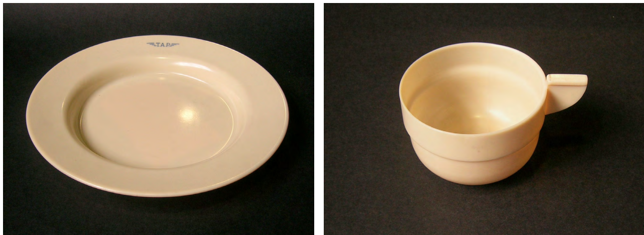
Fig. 2a e 2b

mesma quantidade de guardanapos. A estes somavam-se 200 copos descartáveis de papel ( Dixie cups ) (AviQUIPO, 1946, p.2) [13]. Nos aviões do modelo Dakota as refeições eram servidas em bandejas apoiadas sobre as pernas, nos Douglas Skymaster os tabuleiros eram rebatíveis (semelhantes aos actuais) e nos Lockheed Superconstellation encaixados nos braços das poltronas.