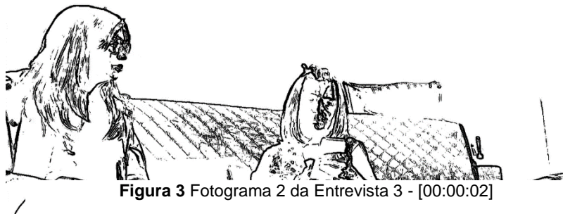
Figura 3 Fotograma 2 da Entrevista 3 - [00:00:02]