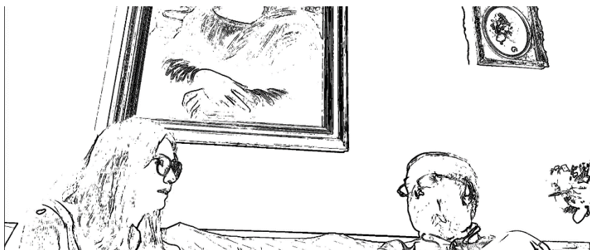
Figura 4 Fotograma 3 da Entrevista 5 - [00:07:10]