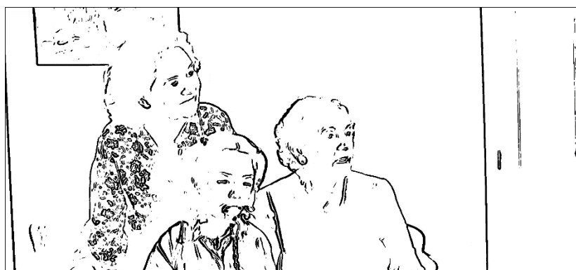
Figura 2 Fotograma 1 da Entrevista 2 - [00:13:48]

No fim da entrevista, a entrevistada apresentou o pai (dependente) à entrevistadora, tendo sido possível analisar a dinâmica familiar e nesse momento, foram abordados alguns assuntos numa conversa informal e descontraída. Por fim, todos os intervenientes despediram-se, houve um agradecimento de ambas as partes e deu-se por terminada a interação.