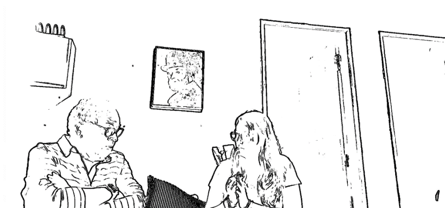
Figura 6 Fotograma 5 da Entrevista 7 - [00:00:32]

No fim, houve um agradecimento de ambas as partes, a entrevistada deu a conhecer medidas de políticas existentes atualmente, para que o cuidador pudesse beneficiar das mesmas. A entrevistadora despediu-se da esposa do cuidador e do cuidador, dando-se por terminada a intervenção entre os intervenientes.