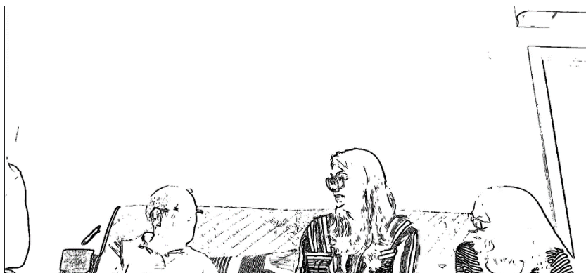
Figura 7: Fotograma 6 da Entrevista 8 - [00:05:28] –

diariamente. No final, todos despediram-se da entrevistadora e houve novamente uma demonstração de agradecimento pela colaboração dos entrevistados.