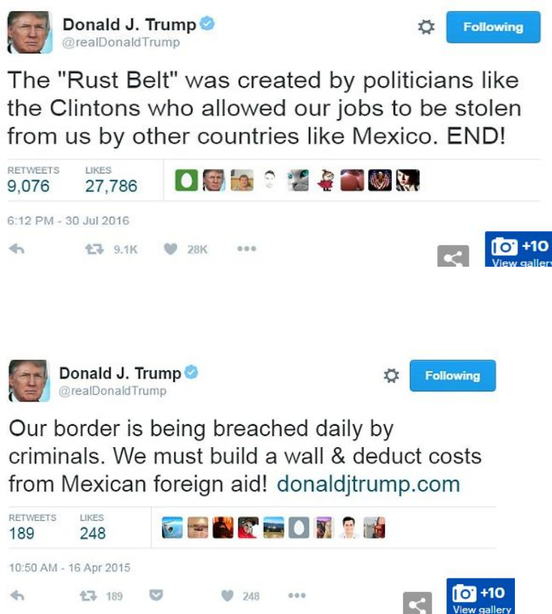
Figura 2 – Mensagens de Donald Trump na rede social Twitter a propósito da imigração mexicana

as intenções de voto do eleitorado americano, como sucedeu com a questão da emigração do México para os EUA. Ciente da grande e crescente preocupação do povo americano com assuntos como a segurança interna e o desemprego, Trump procurou utilizar o argumento de que urgia travar tal movimento migratório, pela criação de um muro impenetrável que seria pago pelos próprios mexicanos: