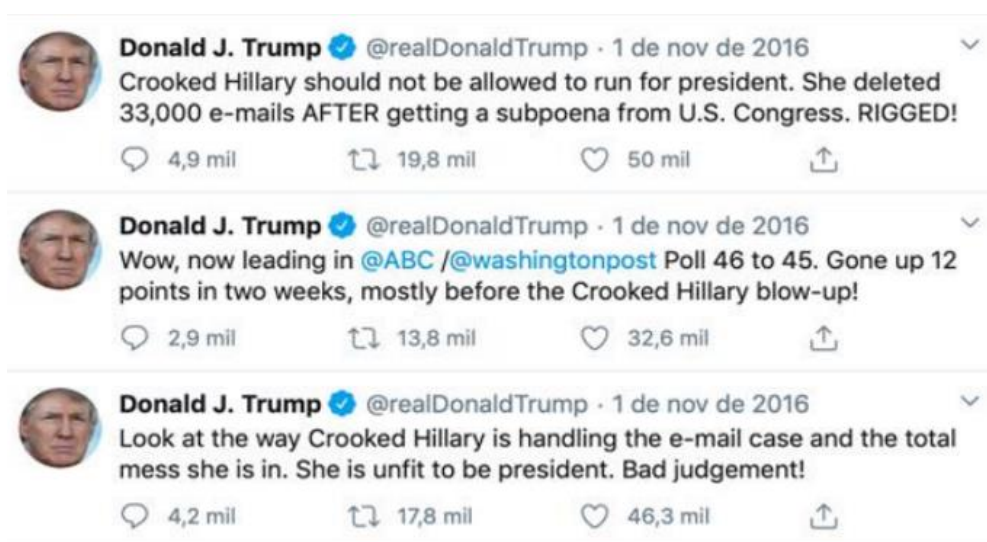
Figura 3 – Mensagens de Donald Trump na rede social Twitter a propósito do caso dos emails de Hillary Clinton

Neste contexto, Donald Trump não desaproveitou a oportunidade para colocar em causa a idoneidade e o carácter de Hillary Clinton, por intermédio de publicações no Twitter, mais uma vez, apelidando-a de “Hillary vigarista”.