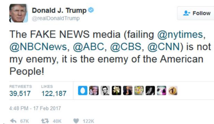
Figura 1 – Mensagem de Trump na rede social Twitter a propósito dos órgãos de comunicação social que divulgam notícias que lhe são desfavoráveis.

Além da novidade das redes sociais, com Trump é efetuada ainda uma outra inovação no que concerne à utilização de fake news, que foi alargar o seu âmbito de utilização: por um lado, usa notícias falsas para desprestigiar os seus adversários e para melhorar a sua reputação enquanto político e, por outro lado, sempre que na comunicação social surge algum tipo de notícia ou informação que lhe é prejudicial, Trump não hesita em qualificar tais notícias como falsas e em denegrir os órgãos de comunicação que as veicularam, circunstância que, aliás, se tornou uma das suas imagens de marca: