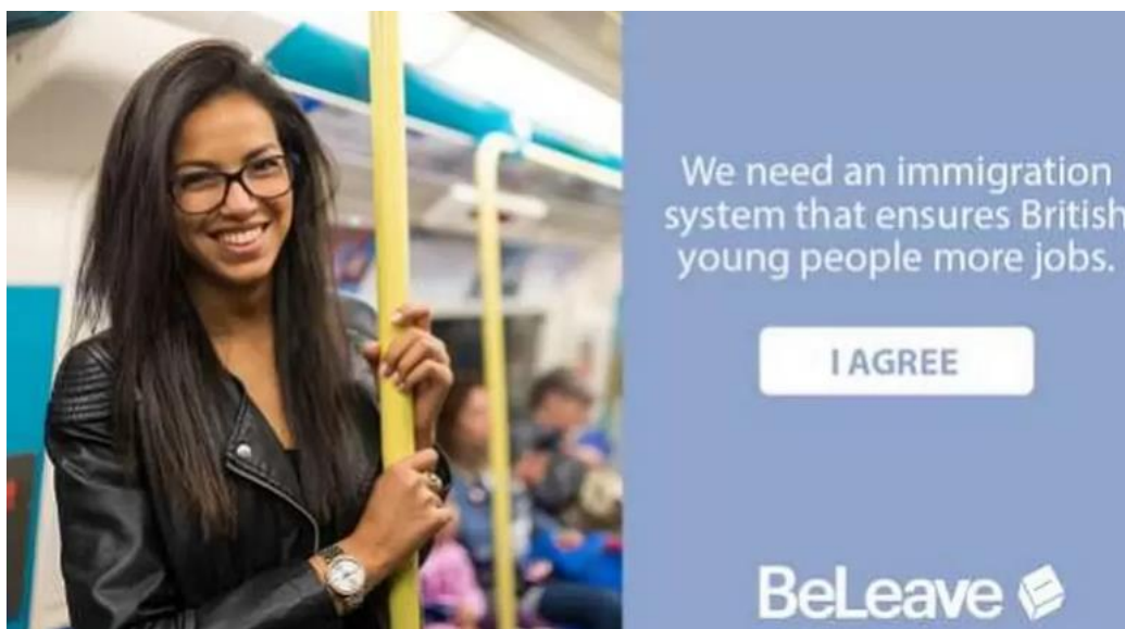
Figura 2: Notícia acerca de imigração para o Reino Unido