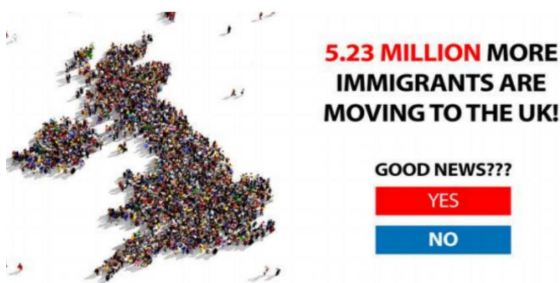
Figura 1: Notícia acerca de imigração para o Reino Unido