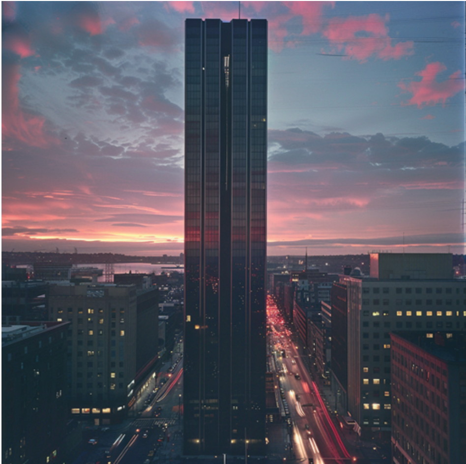
"John Hancock Tower", (1973, Bóston).