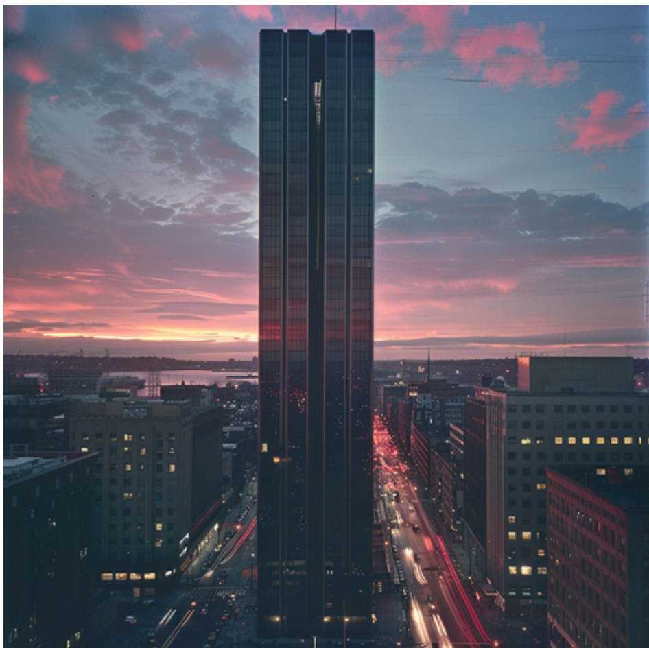
"John Hancock Tower", (1973, Bóston).