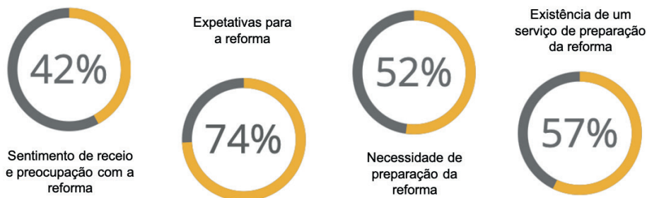
Figura n.º 1 – Resultados obtidos através do inquérito por questionário