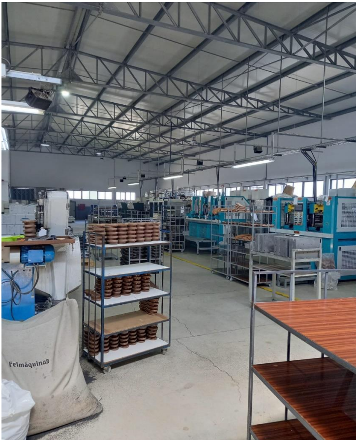
Figura 1- Unidade industrial de produção de solas para sapatos.

Segundo Jacobides e Reeves (2020) a pandemia do Covid-19 afetou gravemente o consumo, forçando as pessoas a largar velhos hábitos e adotar novos, é, portanto,