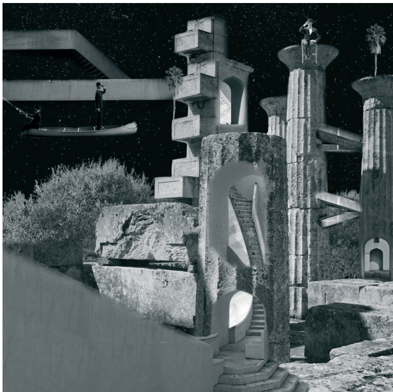
Ilustração 2 - Templo de Afaia VIII em Egina como suporte de uma narrativa imagética. (Margarida Godinho Rocha, 2023).

Vivemos sob um profundo oceano de estrelas e de mistérios, num mundo em constante metamorfose, repleto de estímulos que alimentam seres complexos com um inexplicável superpoder - a Imaginação , que lhes permite viajar no tempo e no espaço, projetando o futuro com base em imagens que constituem a sua mente através das suas próprias experiências perceptivas e da relação com o mundo. Este superpoder intrínseco à espécie humana oferece a extraordinária capacidade de imaginar e simular ficções coletivas, de criar representações sensíveis e de transformar o mundo natural em função das suas necessidades a partir do teletransporte de pensamentos e desejos do mundo das ideias para a realidade. Esta habilidade de simular o futuro através da criação de cenários mentais fez de nós mestres da terra assim como o nosso instinto de curiosidade que nos levou a descobrir o mundo.