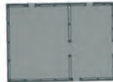
Figure 5 - Ancient house in Casa Branca [20]