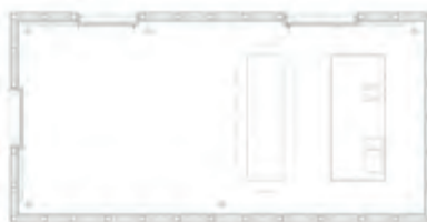
Figure 6 - Comporta house 2 [21]

O Sul de Portugal é diferente. Mais perto do Mediterrâneo e do norte da África, a paisagem e a arquitectura podem ser definidas por conjuntos de volumes brancos sobre as serras e planícies. Entre a costa atlântica e o estuário do rio Sado, a Comporta situa-se numa zona muito sensível de paisagem protegida. Nesta zona as casas e abrigos da arquitectura popular utilizavam espécies vegetais, madeira e colmo como materiais de construção. Pontuando a paisagem podemos ainda encontrar inúmeros abrigos que sustentam o quotidiano de pescadores e agricultores. Alguns constroem com paredes e telhados de colmo [figura5], outros com paredes rebocadas [figura3]. Estas pequenas casas eram compostas por dois espaços, um onde dormia a família e outro onde se vivia e cozinhava.