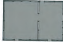
Figure 3 - Ancient house in Setil [18]