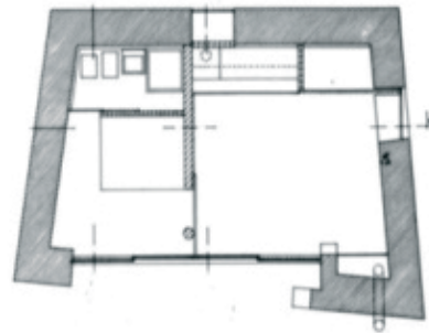
Figure2 - Gerês House [17]

A casa do Gerês (Vieira do Minho 1980-1982) é uma das primeiras obras de Souto de Moura. A casa situa-se no norte de Portugal. No meio