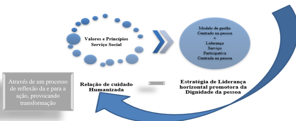
Ilustração 2 - Processo de humanização da relação do cuidado

Na ilustração 2 procura-se representar graficamente o processo que dá lugar à humanização da relação de cuidado, com base no enquadramento teórico conceptual.