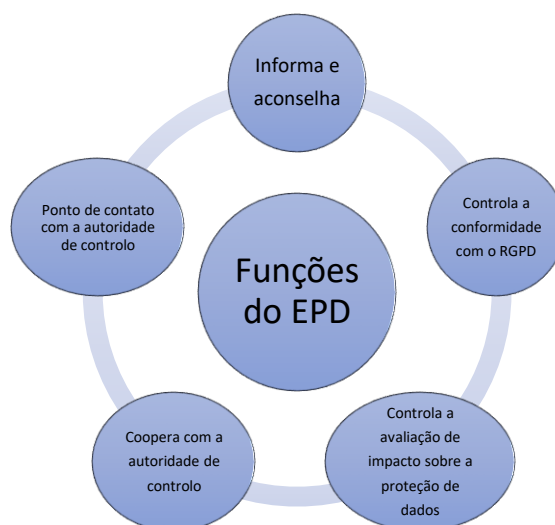
Figura 1 – funções do EPD

como responsabilidade do EPD. A figura seguinte demonstra as principais funções do EPD: