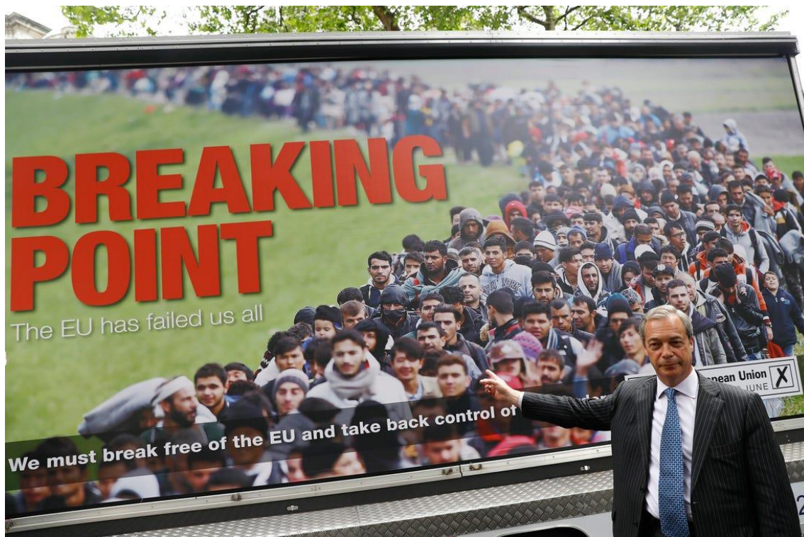
Figura 4 - REUTERS/Stefan Wermuth. (2016). Nigel Farage's new Brexit poster.