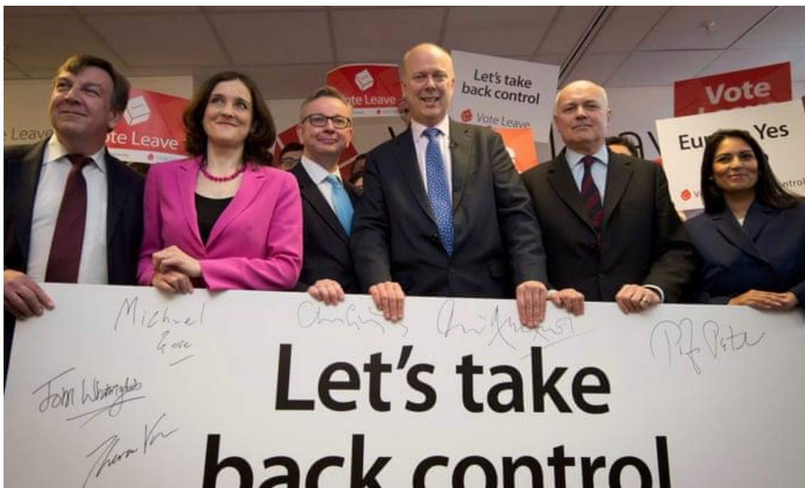
Figura 3 - (2016). John Whittingdale, Theresa Villiers, Michael Gove, Chris Grayling, Iain Duncan Smith and Priti Patel at the launch of the Vote Leave campaign in central London.