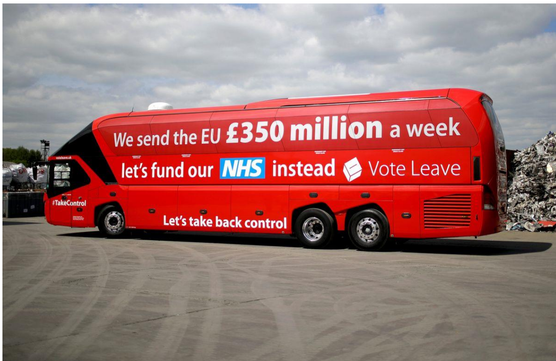
Figura 5 (2016). The Vote Leave campaign bus in May 2016.

The Leave campaign had all the best tunes. “Take back control” was a brilliant slogan. £350 million a week was disgraceful in one sense, because it’s not true, but I thought it was incredibly tenacious, as well as deeply cynical, that they were just sticking to it, in the face of all the criticism that it was a lie. It cut through in the focus groups (Shipman, 2016).