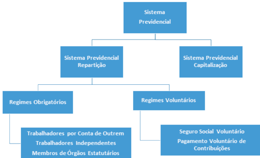
Figura 1 - Arquitetura do Sistema Previdencial