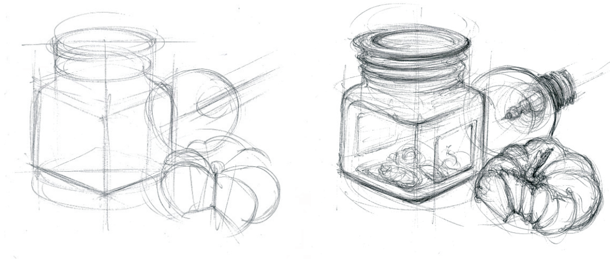
Figuras 2 e 3 - desenho de aluno

Todas as características que observámos, baseadas no controle das variáveis que elencámos (e de outras que não chegámos a elencar) podem ser engenhosa e sabiamente integradas em procedimentos metódicos, com fins pedagógicos. Disso trata a nossa disciplina, disso apresentaremos aqui uma breve ilustração.