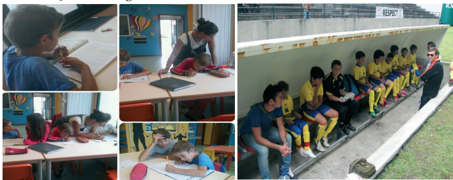
Ilustração 2 – Imagens da atividade ‘Escolinha social de futebol de rua’

No decorrer do projeto participaram 192 crianças e jovens na ‘Escolinha Social de Futebol de Rua’. Aliando os resultados escolares das crianças com a titularidade nos jogos e intercâmbios sociodesportivos e nos torneios comunitários, foi possível verificar uma evolução e mudança positiva dos participantes e da comunidade em geral, comprovada pela redução das situações de exposição a comportamentos de risco, abandono, absentismo e insucesso escolar, tal como a melhoria das competências pessoais e sociais. O sucesso educativo dos participantes aumentou quer a nível dos resultados, quer na