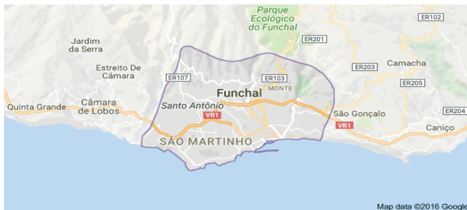
Ilustração 1 – Freguesia de Santo António, Funchal