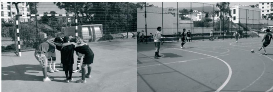
Ilustração 3 - Imagens da participação no ‘Torneio Regional de Futebol de rua da Madeira’

Até ao final de 2015 participaram 104 jovens e adultos no torneio regional de Futebol de Rua. A atividade destina-se a jovens e adultos em situação de