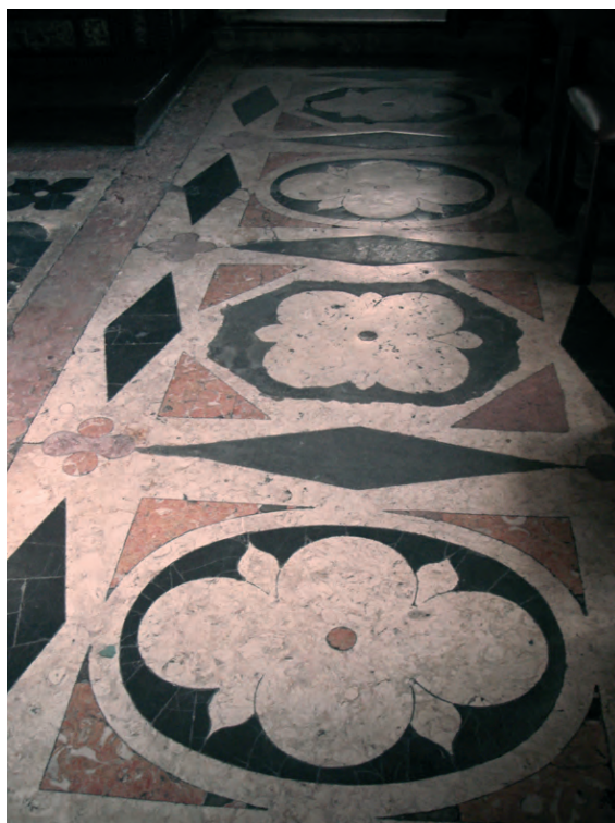
Foto 10 - Chão policromo de mármore

Do lado direito acha-se a entrada para a sacristia de planta quadrangular, com pavimento de embutidos de mármore policromo, tecto de madeira plano.