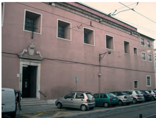
Igreja de Nossa Senhora da Quietação