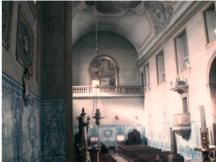
Foto 14 - Vista da nave, púlpito e coro alto

O coro, amplo espaço com magnífico cadeiral, possui tecto de madeira, dividido em painéis, com frisos decorativos pintados a têmpera. Na parede do fundo sobressaem estofadas e douradas as imagens de santo António e santa Rita.