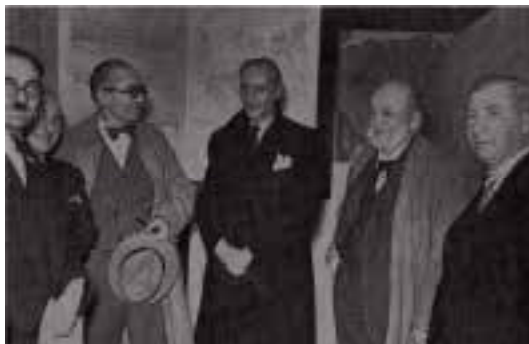
Ilustração 15 – Fotografia publicada na revista L'Architecture d'Aujourd'hui , nº11. Mallet-Stevens ao centro com Le Corbusier à sua direita e Auguste Perret à sua esquerda. (Cinquembre, 2005, p.14).

Deste modo, o arquitecto demonstra que acredita plenamente tanto na arquitectura moderna em geral, como na modernidade da sua obra – bem como na novidade com que esta se projecta no tempo.