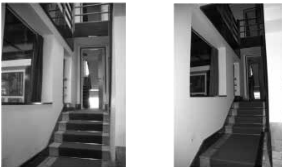
Ilustração 91 – Aberturas que permitem a visualização da sala de jantar. (Susana Santos, 2011).

ao facto de se registar o percurso dos corpos no espaço, que vão desaparecendo e aparecendo mediante o movimento ascendente e descendente que executam.