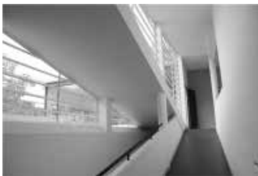
Ilustração 62 – Rampa que percorre o interior da Villa Savoye..

A rampa coloca o corpo de um modo suave a realizar o percurso ascendente no espaço, e deste modo, somos levados na promenade architectural , singular, de Le Corbusier.