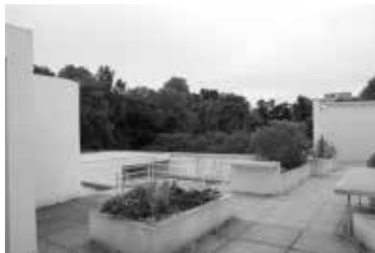
Ilustração 56 – Solário. Villa Savoye. (Susana Santos, 2011).

A profundidade do campo esclarece a profundidade dos vários planos. Conseguimos ver através das várias cenas. Podemos atravessar o espaço da sala, e sossegar o nosso olhar nas árvores que rodeiam a casa.... Explicitando com imagens, as quatro direcções possíveis que depois de reunidas formam os 360°. Nesta posição, no “coração” da casa, fruimos do potencial de reconhecimento da estrutura espacial no seu todo.