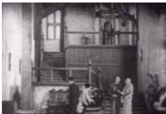
Ilustração 93 – Cenas de Easy Virtue . Perspectivas da escadaria. (Hitchcock, [s.d.]).

Evocamos a escada como meio privilegiado de fazer as comunicações verticais, e estabelecer o desenrolar poderoso e dramático do filme. “Staircases enable Hitchcock to create depth in the single set and to mobilize the cinematic space.” (Jacobs, 2007, p.82).