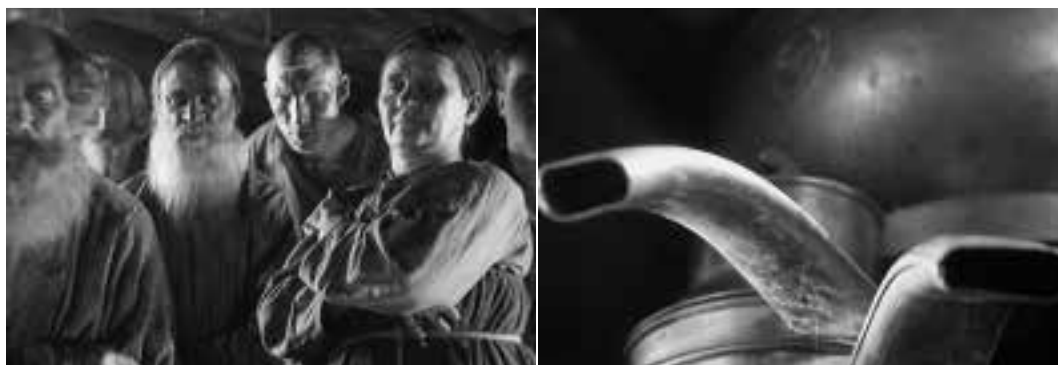
Ilustração 53 – Cenas do filme A Linha Geral . Expressão da tensão nos rostos dos agricultores ao olharem os bucais da desnatadeira. (Eisenstein, 2002b).

Um segundo momento, onde as máquinas são personagens principais, surge quando Marfa faz a grande visita à cooperativa. Visita que incide sobre o funcionamento da cooperativa, tendo o seu auge na visita à fábrica de engarrafamento de leite. O exterior do edifício desenhado por Burov, assume as volumetrias puras, a cor clara (devido ao filme ser preto e branco, supostamente a cor do edifício é branca), as aberturas envidraçadas, as coberturas planas e, no seu interior, a azáfama do movimento filmado de um modo contundente.