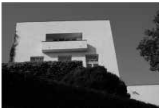
Ilustração 98 – Exterior Norte da Villa Müller. (Susana Santos, 2010).