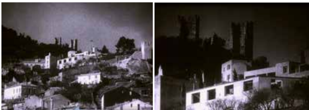
Ilustração 32 – Cenas de Les Mystères du Château du Dé . Imagens da Villa Noailles e a sua relação com o lugar onde se vê o castelo ao fundo. (Ray, 2007).

A Villa Noailles, situada junto às ruínas de um antigo castelo, saboreando nas suas costas a protecção da colina, expande-se para a frente em direcção ao horizonte. A relação que a casa estabelece com o lugar, vive sobretudo da relação com a elevação que a abriga do castelo, fazendo com que a casa se solte para sul. Parece até que a Villa se concentra na matéria, para empurrar o espaço vazio e criar o amplo pátio que a protege da visão alheia. Uma relação forte de partilha entre o lugar e a casa. Uma relação física, de entrelaçamento.