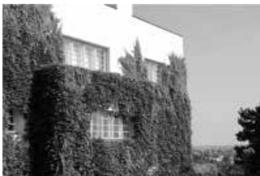
Ilustração 99 – Exterior Este da Villa Müller. (Susana Santos, 2011).