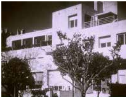
Ilustração 41 – Cena de Les Mystères du Château du Dé . Alçado principal da Villa Noailles. (Ray, 2007).

O filme inicia-se com uma jogada de dados que decide que os jogadores farão uma viagem de carro até Hyères. A viagem leva-os à Villa Noailles. No caminho de acesso à casa, Man Ray vai ainda mais longe, e exalta a referência à velocidade. A câmara de filmar capta o movimento do carro ou o movimento de um comboio, entrecotados com a marcação vertical dos postes ou das árvores que ladeiam a estrada, ou ainda a linha do caminho de ferro, enfatizando a velocidade. Como um road-movie , a câmara no carro move-se ao sabor da estrada. As imagens do movimento, vão sendo cruzadas com imagens de postes eléctricos, fábricas, pontes e árvores, marcando o ritmo e acentuando a aceleração. O objectivo desta viagem é a Villa Noailles que se vai desvendando; que se vai aproximando. No seu interior a narrativa toma forma, Man Ray filma os contrastes de luz e sombra, de claro e escuro, de longe e perto, virtuosamente.