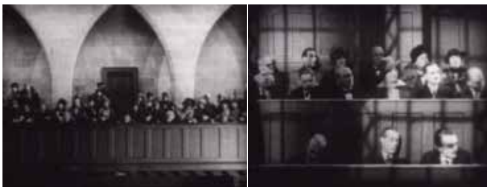
Ilustração 84 – Cenas de Easy Virtue . Efeito de luz e sombra. (Hitchcock, [s.d.]).

Hitchcock ao enfatizar a penumbra, a sombra, consegue retirar vantagem da vivência mais lunar que enquadra. Em Easy Virtue , apercebemo-nos que existem dois modos distintos de trabalhar a luz. Nas primeiras cenas do tribunal, no início do filme, a relação entre a luz e a sombra são trabalhadas de modo a enfatizar um sentido de profundidade na própria cena. Este objectivo é conseguido devido ao facto da projecção da sombra se “espalhar” sobre os planos, ou sobre as figuras. Ao assumir a projecção da sombra potencia-se a vivência da luz.