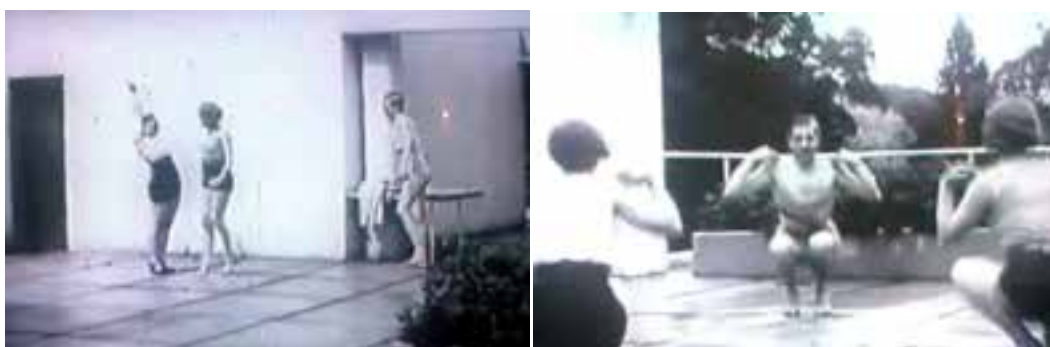
Ilustração 50 – Cenas de Architecture d'Aujourd'hui . Terraço da Villa Church. (Chenal, [s.d.]).

Outro dos pontos interessantes de Architecture d'Aujourd'hui , é a sucessão de cenas onde se percebe um controlo da profundidade de campo – enfatizado pela colocação estratégica do observador em relação ao objecto filmado – como por exemplo, na sessão de ginástica na Villa Church. Esta profundidade de campo enquadra a acção, e enquadra, também, a visão do actor para além da visão do espectador. Este enquadramento está reflectido, também ele, de uma forma evidente no projecto para a Villa Savoye.