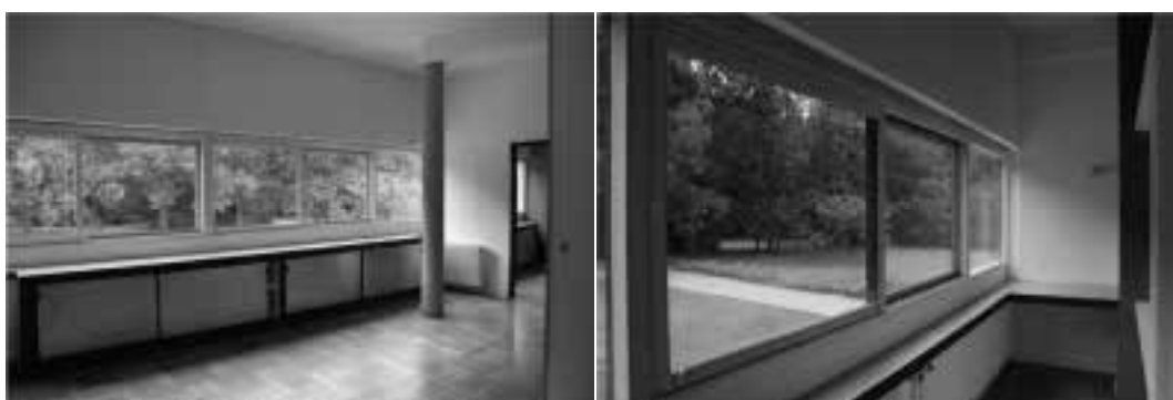
Ilustração 66 – A janela que envolve a Villa Savoye. Fenêtre en longueur . (Susana Santos, 2011).

A entrada da luz na Villa Savoye, é projectada de um modo direccionado, onde a preocupação projectual se estabelece na abertura de vãos nas paredes – fenêtre en longueur – e no plano horizontal superior.