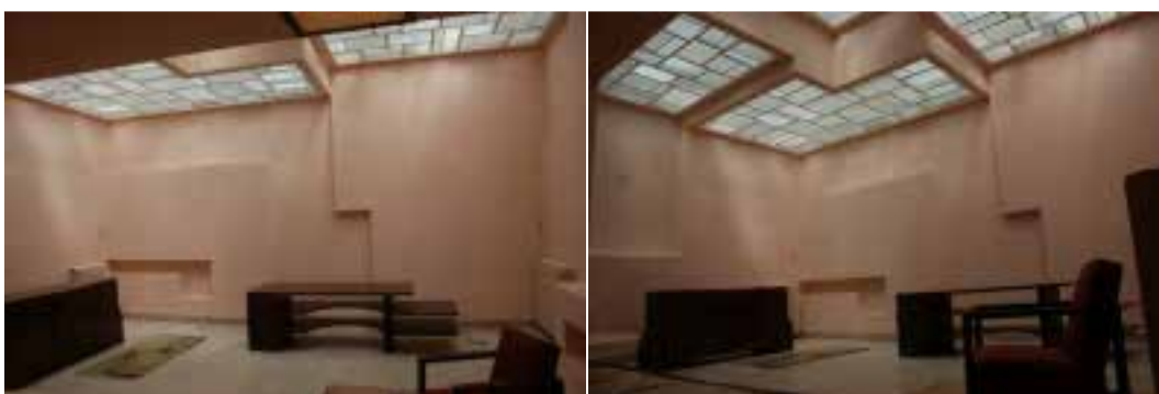
Ilustração 39 – Salão Rosa. Villa Noailles. (Susana Santos, 2009).

Contrariamente às outras divisões da casa, que estabelecem uma relação directa com o exterior, o salão rosa resguarda-se, na sua privacidade, dos olhares alheios. Não tem aberturas para o exterior nos planos verticais que o envolvem.