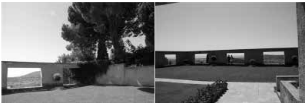
Ilustração 36 – Perspectivas do pátio. Villa Noailles. (Susana Santos, 2009).