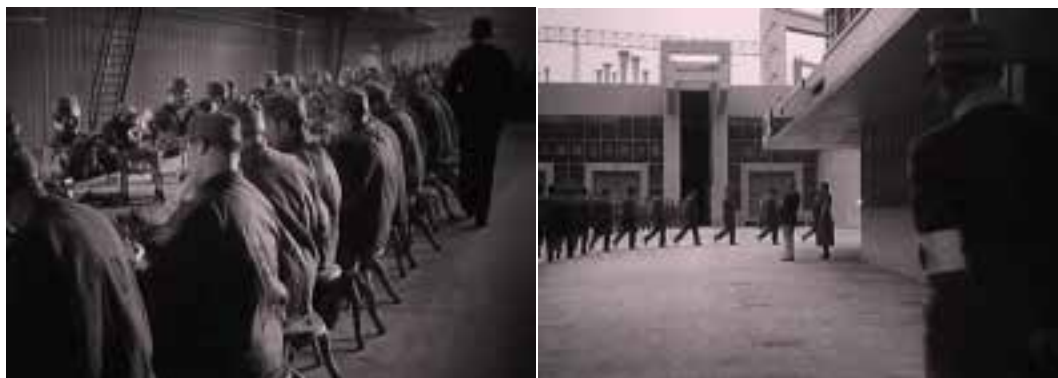
Ilustração 4 – Cenas de À Nous la Liberté! Enfatização da perspectiva. (Clair, 2007).

essencial, pois “(...) set design is a crucial aspect of any film – it is the art of creating vicarious experience. It is about the controlled perception of space – perspectival space, the architectural secret of the Renaissance.” (Valentine, 2000, p.150). O tema que aborda o controlo da perspectiva, na percepção espacial, é um tema caro aos franceses. “The experiments with perspective (...) were to have an impact on design practice throughout the French industry (...)” (Bergfelder et al. , 2007, p.60).