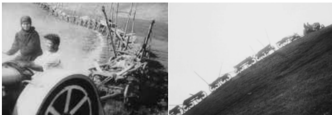
Ilustração 55 – Cenas finais de A Linha Geral . A máquina que supera os carros de bois.(Eisenstein, 2002b).

Por último, o quarto momento, estabelece a conclusão da narrativa. Finalmente é hora do tractor chegar à aldeia. A máquina é mostrada com grande satisfação por Marfa . O tractor é filmado sob várias perspectivas, utilizando o grande plano. Eisenstein foca, mais uma vez, o mecanismo da máquina, o seu modo de funcionar, e preenche o ecrã com imagens, bastante fortes, da máquina a conseguir puxar todos os carros de bois existentes na aldeia. A máquina em oposição ao trabalho animal. Enquadramentos raros.