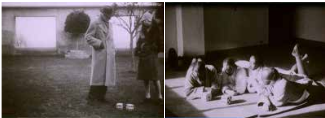
Ilustração 42 – Cenas de Les Mystères du Château du Dé . (Ray, 2007).

Apesar da piscina da Villa Noailles, não fazer parte do projecto de Mallet-Stevens, pois foi construída posteriormente em 1928, no filme de Man Ray todo o espaço da piscina é filmado de um modo singular. No filme Les Mystères du Château du Dé , assume um papel importante pois reforça a ideia que cruza todo o filme: a ideia de movimento. Apercebemo-nos que a piscina funciona como um ecrã. Um ecrã líquido. Este ecrã líquido potencia o movimento, mais que isso, abre as possibilidades aos vários movimentos: o movimento inerente ao próprio movimento da água, os reflexos que ondulam inerentes às sombras dos corpos dos banhistas, o movimento dos banhistas que nadam e cruzam a piscina na sua acção corporal. Potenciando todo este ambiente manipulado pelo ecrã líquido, a reflexão da luz solar tem uma grande afirmação neste espaço. Provêm das grandes aberturas que o espaço da piscina tem para a sul mas, preferencialmente a luz é filtrada pelo intrincado desenho geométrico do plano superior que toma conta do espaço tornando-o vibrante e livre devido à sua reflexão na água, e que vai inundar o espaço.