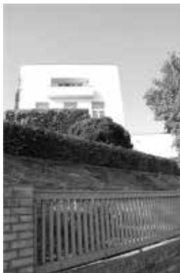
Ilustração 79 – Fachada Norte. Villa Müller. (Susana Santos, 2010).

Loos projecta o espaço pensando já na articulação deste com o mobiliário. Sem ornamentação exagerada, o que reflete que no seu exterior a ornamentação tende para ser nula. Esta posição de Loos, está em oposição ao exagero ditado pelas correntes anteriores nomeadamente a art nouveau .