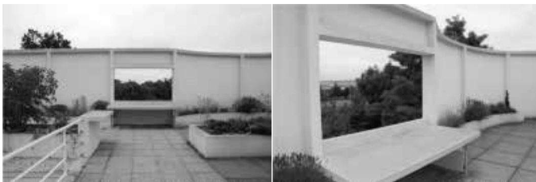
Ilustração 68 – A visão enquadrada. Solário. (Susana Santos, 2010).

Na subida que o corpo faz, ao percorrer a rampa, enquadra-se a visão através da abertura, estrategicamente e dramaticamente, colocada no plano vertical emergente do solário: “In addition, the solarium acts as a machine for generating views: on the one hand, plunging vistas down onto the architecture of the house and on the other hand, contained views controlled by the screens of the solarium’s walls.” (Sbriglio, 2008, p.74).