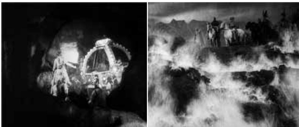
Ilustração 3 – Cenas de Die Nibelungen . (Lang, 2004).

Deste modo, o que diferencia a cenografia alemã, é a criação de um ambiente muito particular – construído pelas equipas de realização alemães –, que se projecta para além da representação do lugar ou da “arquitectura” relativa ao cenário, pois soma a qualidade dramática da acção, que não se vê mas sente-se. Este ambiente, a que nos referimos, funciona como uma carga energética que se apresenta e que constrói o dramatismo do filme. Uma conjugação de factores, como cenários, actores, luzes, guarda-roupa, guião e realização que na sua articulação geram a especificidade do ambiente.