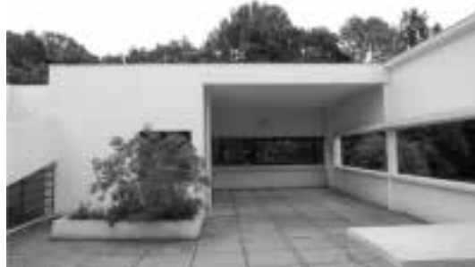
Ilustração 60 – Pátio da Villa Savoye. Focando direcção Este. (Susana Santos, 2011).

A geometria do espaço é transposta para a geometria da forma que se expressa, também, no desenho do pavimento.