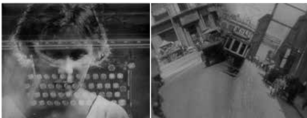
Ilustração 18 – Cenas de O Homem da Câmara de Filmar . Registo de justaposição e sobreposição de imagens. (Vertov, 2010).

Registam-se as experiências já referidas de Man Ray, com as suas rayographs e as experiências de Dziga Vertov nomeadamente com O Homem da Câmara de Filmar (1929), onde a transparência é transposta para o filme por via das experiências com a sobreposição das imagens e a justaposição das mesmas.