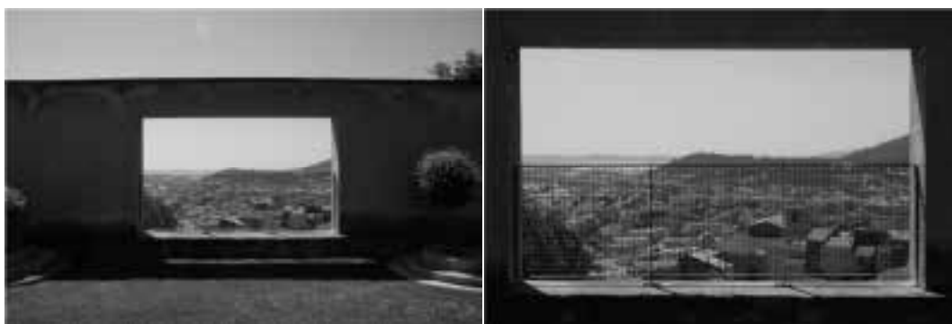
Ilustração 37 – Perspectivas do pátio. Villa Noailles. (Susana Santos, 2009).