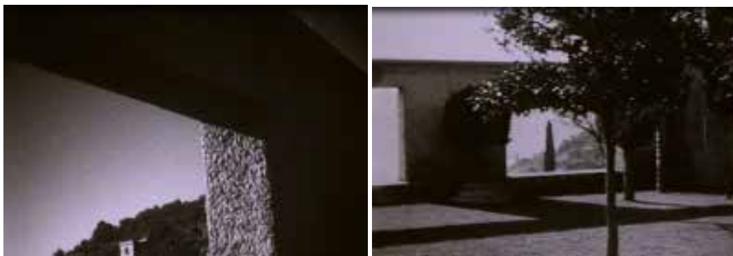
Ilustração 44 – Cenas de Les Mystères du Château du Dé . Filmagem dentro do pátio da Villa Noailles. (Ray, 2007).

Nas primeiras filmagens do pátio, a câmara está colocada dentro do mesmo e roda em torno de um eixo. Nas filmagens finais do pátio, a câmara encontra-se no terraço, sobre o pátio da Villa Noailles, e quem opera a câmara efectua uma rotação da mesma sobre a visão do pátio. São duas rotações diferentes sobre o mesmo espaço.