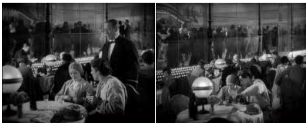
Ilustração 21 – Cenas de Sunrise . Tridimensionalidade potenciada pelos planos de vidro. (Murnau, 2006).

Outro dos exemplos que nos coloca perante a enfatização da tridimensionalidade da acção, centra-se na cena nocturna do parque de diversões. Um enorme plano de vidro separa o salão de dança da zona de jantar, que se encontra em primeiro plano. Nesta cena, por um lado, é enfatizada a ideia de transparência e, por outro, explicitada a profundidade de campo. As cenas passam-se sobrepostas: no primeiro plano, acompanhamos o desenrolar do jantar dos protagonistas; no plano de fundo, o baile acontece no seu ritmo de dança; entre os dois planos, uma cortina de vidro. A relação entre os vários planos cinematográficos enaltece o dinamismo e o movimento referente à acção, e a imagem deixa de ser rasa tornando-se tridimensional.