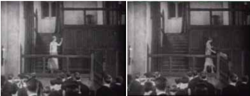
Ilustração 95 – Cenas de Easy Virtue . Sequência da descida de Larita . (Hitchcock, [s.d.]).