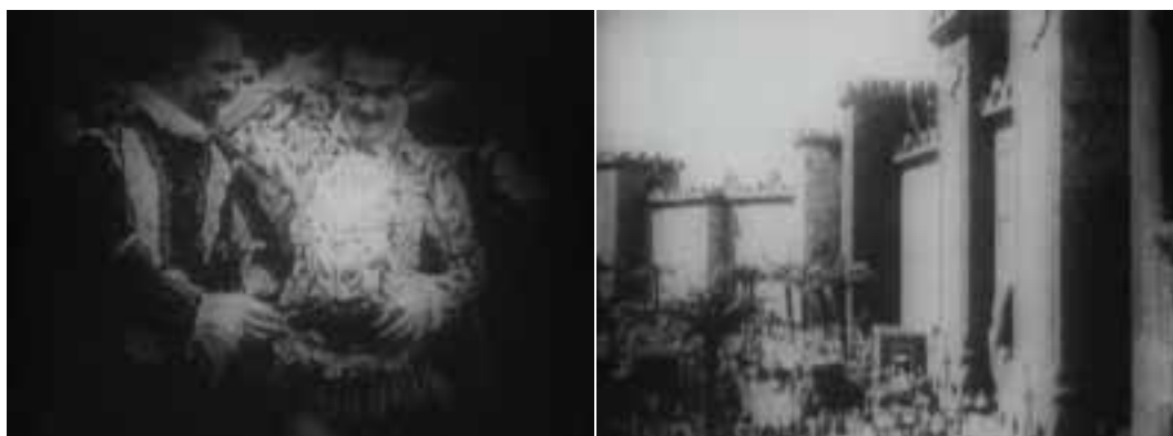
Ilustração 8 – Cenas da terceira e quarta história de Intolerance . (Griffith, 2006).

princípio do século XX. A primeira história centra-se no tempo presente – relativo às filmagens de Griffith, 1915, nos EUA, a segunda história tem lugar em Jerusalém no tempo de Cristo, a terceira história ocorre em Paris, na segunda metade do século XVI e, por último, a quarta história tem lugar na Babilónia, séculos antes do nascimento de Cristo. Todas as narrativas se vão apresentando, cada qual com o seu conjunto de personagens. O filme tem mais de duas horas, e as histórias vão se intercalando na estruturação de um todo. A montagem de Intolerance reflecte uma atitude inovadora e um controlo sequencial da narrativa. Parece ser certo que este filme de Griffith, marcou Eisenstein de um modo muito contundente, abrindo-lhe caminho para uma nova visão do cinema.