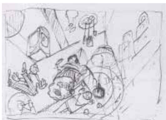
Ilustração 25 – Estudo de Eisenstein, para a realização de Glass House . (Eisenstein, 2009, p.20).

A ideia expressa de filmar sob o tema da transparência, determina, numa outra esfera, a total falta de privacidade. Ou seja, a intimidade é voltada do avesso. Tanto a intimidade dos amantes, “Love scene through a w. closet”, (Eisenstein, 2009, p.19), como, no limite, a intimidade da doença ou da morte quando propõe: uma cena onde se observa uma mulher que morre num espaço transparente. (Eisenstein, 2009, p.17).