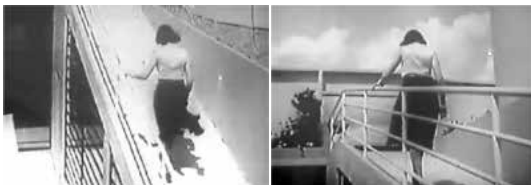
Ilustração 49 – Cenas de Architecture d'Aujourd'hui . Rampa de subida ao terraço-jardim. (Chenal, [s.d.]).

Em Architecture d'Aujourd'hui , o movimento da câmara enfatiza o movimento da acção das pessoas no espaço, em várias cenas, como, por exemplo, na cena relativa à promenade sobre a rampa exterior da Villa Savoye. Para além desta demonstração do movimento – o corpo no espaço – o filme revela, também, uma atenção particular à noção do tempo, no sentido em que na filmagem da já referida rampa – que conduz ao solário –, são realizados vários cortes na sequência das imagens para enfatizar a duração da acção.