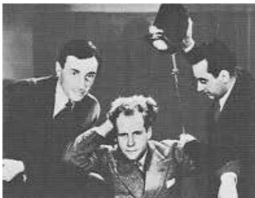
Ilustração 17 – Eisenstein com Hans Richter e Man Ray. (Bouquet, 2008).

O cinema por contingência própria, nasce, fisicamente, sob a materialização da transparência. Fisicamente, a fita de projecção – celulóide – é ela própria transparente. O meio de projectar o filme contempla o facto de a luz ter de atravessar a película (mais ou menos transparente ou mais ou menos opaca) para se projectar na tela.