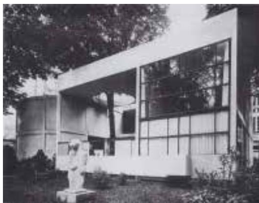
Ilustração 16 – Pavilhão de l'Esprit Nouveau , Paris, Le Corbusier. (Albrecht, 2000, p.8).

dos edifícios: transparência. (Giedion, apud , Blau, Troy, 2002, p.1). Vários projectos tornam-se rapidamente referências da nova arquitectura moderna, apoiada na transparência, entre eles o projecto de Bruno Taut de 1914, para a Exposição Deutscher Werkbund , marcado pela presença de uma cúpula de vidro. Um pouco mais tarde, em 1922, Mies van der Rohe, projecta para Nova Iorque um arranha-céus de vidro – uma estrutura interior que suporta uma membrana de vidro ondulante, assumindo, todo o edifício, uma transparência intrínseca –, no entanto, este projecto nunca chegou a ser construído. Uns anos depois em 1925, em Paris, na Exposition Internationale des Arts Décoratifs et Industrielles Modernes , Le Corbusier apresenta o Pavillon de l'Esprit Nouveau . Este pavilhão é marcado por grandes janelas de vidro – numa composição assimétrica –, pela cobertura “flutuante”, com uma grande abertura circular, que potencia a ilusão de leveza espacial e formal. (Albrecht, 2000, p.9).