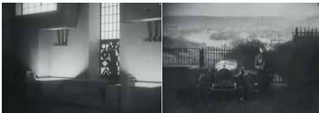
Ilustração 31 – Cenas de L'Inhumaine , cenário de Mallet-Stevens. A entrada da casa de Claire Lescot. A visão sobre a cidade. (L'Herbier, 1924).

No entanto, outras questões também relevantes caracterizam esta mesma interligação. Como exemplo, o facto da entrada da Villa Noailles se encontrar a uma cota mais elevada que a cota do pátio onde se situa. Os três degraus que marcam a entrada, projectam a porta da entrada para uma situação de destaque face à fachada da Villa. O mesmo acontece com a casa de Claire Lescot em L'Inhumaine . Deste modo, ao criar alguns degraus e afastar a casa do chão, Mallet-Stevens valoriza a posição do corpo face à entrada na habitação – essa diferença de cota, face ao plano onde circulam os carros, facilita a leitura das personagens que compõem o enquadramento.