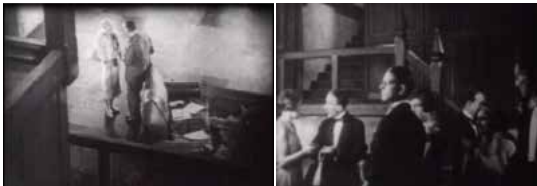
Ilustração 92 – Cenas de Easy Virtue . Perspectivas da escadaria. (Hitchcock, [s.d.]).

um efeito particular que trabalha de modo intencional a posição do actor sobre o espaço: “(...) dizzying effect that relies on strong architectural spatial cues of the staircase seen from the vantage point of the character.” (Jacobs, 2007, p.28).