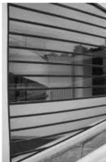
Ilustração 51 – Relação entre a escada e a rampa. (Susana Santos, 2010).