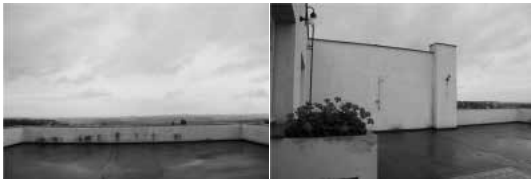
Ilustração 75 – Terraço da Villa Müller.