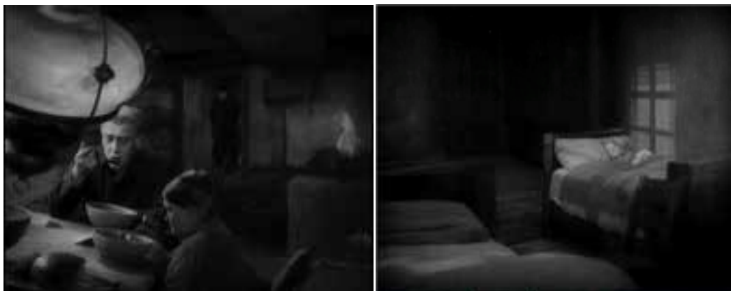
Ilustração 11 – Cenas de Sunrise: A song of two humans . (Murnau, 2006).

volumetria do espaço. De um modo mais elaborado, a qualificação dos espaços é conseguida através do trabalho da luz.