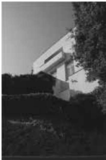
Ilustração 101 – Exteriores Norte da Villa Müller. (Susana Santos, 2010).