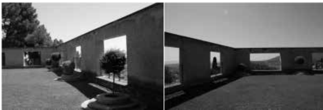
Ilustração 35 – Perspectivas do pátio. Villa Noailles. (Susana Santos, 2009).

É como que se habitássemos o correr de uma história, de uma narrativa cinematográfica. A acção desenrola-se à medida que nos movimentamos no espaço, incluindo-nos. Somos actores na medida em que descobrimos a acção. O corpo que percorre este pátio é confrontado com a ideia de movimento e de tempo em simultâneo. Mallet-Stevens enquadra e emoldura o espaço.