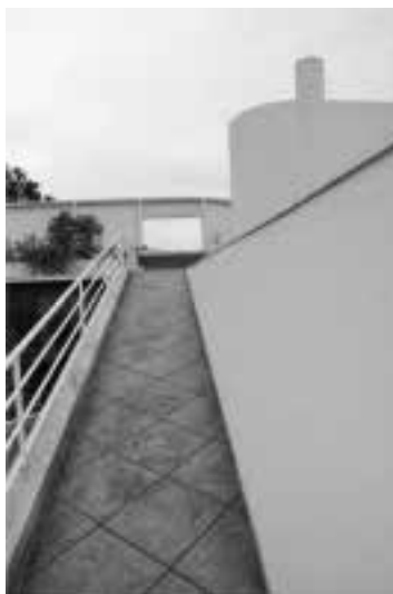
Ilustração 69 – Sequência de chegada ao solário. (Susana Santos, 2010).