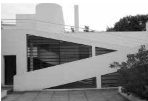
Ilustração 57 – Pátio da Villa Savoye. Focando direcção Norte. (Susana Santos, 2011).

Olhamos para Norte, a sucessão de planos acontece de um modo evidente. A visão da rampa é primordial, a rampa que nos leva ao solário, mas que, em relação à posição onde nos encontramos, cruza em diagonal o espaço.