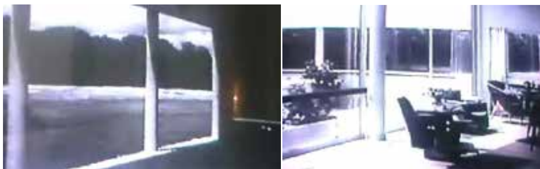
Ilustração 48 – Cenas de Architecture d'Aujourd'hui . Acesso à garagem. Interior da sala com visibilidade para o pátio. (Chenal, [s.d.]).

entrar no interior de cada uma destas –, coloca em evidência todas as questões que deram origem à conceptualização da Villa Savoye – apesar do filme focar, também, outras obras, entre os quais, as três casas individuais, já mencionadas, projectadas por Le Corbusier e Pierre Jeanneret.