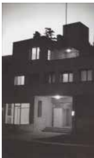
Ilustração 27 – Exterior da Villa Noailles, Mallet-Stevens. (Carrassan, 2001, p.39).

Este jogo de volumes é fruto do trabalho de Mallet-Stevens. Aliás, Mallet-Stevens assume o jogo de volumes como sendo um dos primeiros pontos fundamentais para a construção do cenário cinematográfico.