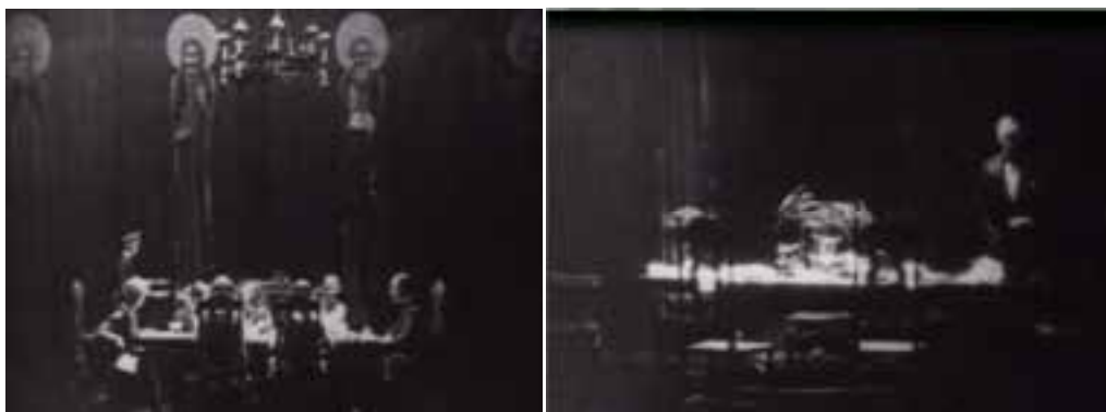
Ilustração 85 – Cenas de Easy Virtue . Efeito de luz e sombra. (Hitchcock, [s.d.]).

O outro modo que Hitchcock usa para trabalhar a penumbra, é o obscurecimento do cenário no seu todo, iluminando somente a parte que pretende realçar. A sombra apodera-se do todo do cenário garantindo maior dramatismo à cena. É exemplo a cena relativa ao jantar em casa da família de John, quando a tensão entre Larita e a mãe deste John se consuma.