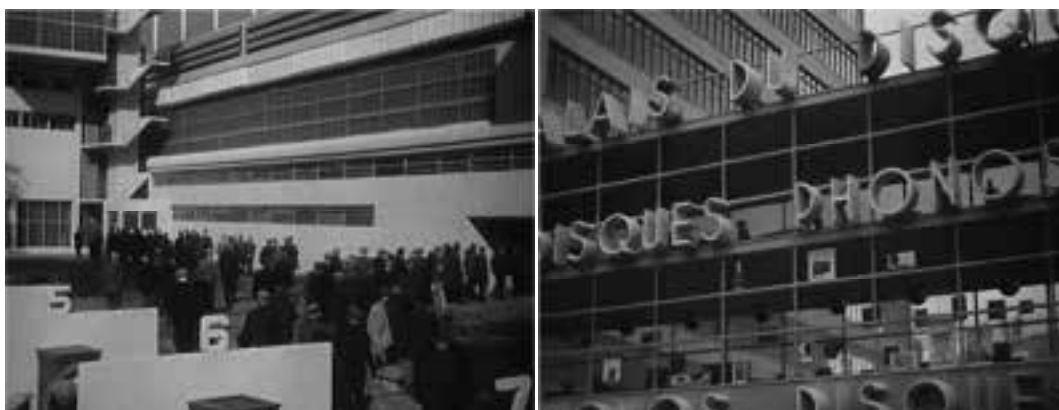
Ilustração 19 – Cenas do filme À Nous la Liberté! (Clair, 2007).

O cinema trás para a sua esfera cenográfica, influências da arquitectura marcada pela utilização do vidro como modo de fazer e de se expressar. A transparência é definida como matéria conceptual e técnica, que promove a inovação tanto na arquitectura como no cinema – contingência e cunho da modernidade do início do século XX.