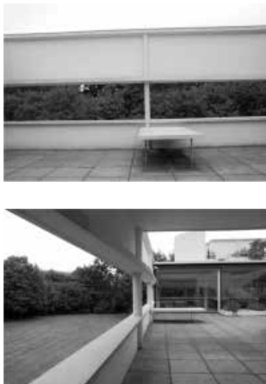
Ilustração 59 – Pátio da Villa Savoye. Focando direcção Sul..

Para Este, a visão, através de um único plano de vidro é atenuada pela densidade e profundidade da sombra projectada pelo alpendre. A sombra e o sol dialogam, e ao longe as árvores aguardam, bem ao fundo.