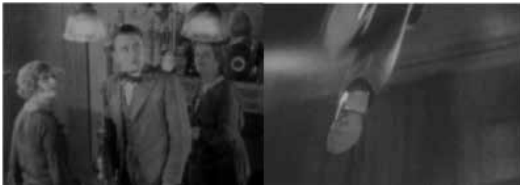
Ilustração 23 – Sequência de The Lodger . Filmagem nas “casas de vidro”. (Hitchcock, [s.d.]).

existe, em relação ao posicionamento das divisões da casa – construídas para o cenário –, a relação efectiva entre a posição correcta das várias salas que compõem a acção resulta a partir da determinação do realizador.