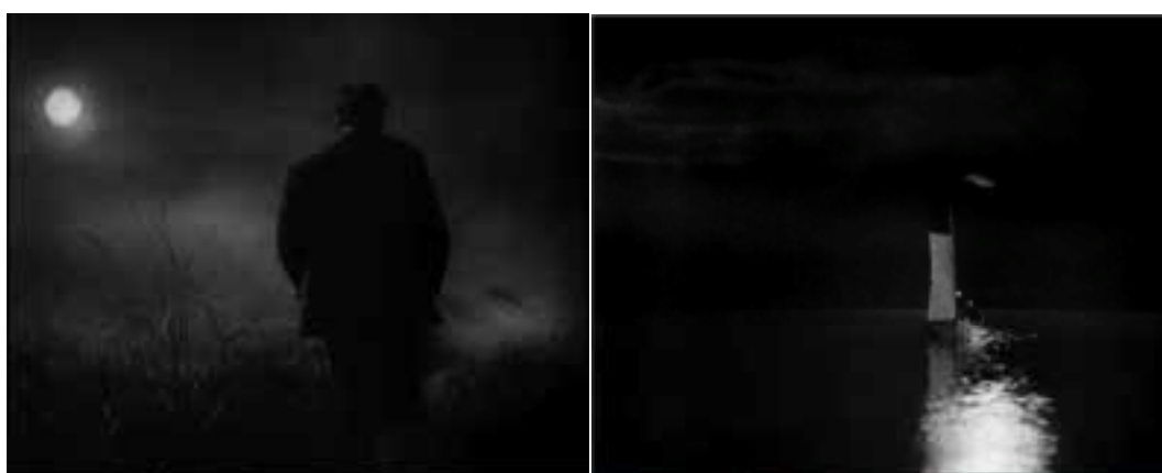
Ilustração 12 - Cenas de Sunrise: A song of two humans . (Murnau, 2006).

Nos espaços rurais, abertos, a paisagem ganha os contornos de limite. Nas cenas nocturnas a noite é marcada pelo luar. Esta luz confere às cenas nocturnas um carácter singular. A luz do luar é trabalhada. Murnau caracteriza o ambiente junto ao rio, onde a luz do luar é filtrada, de modo a influenciar toda a acção, conferindo uma aura de secretismo e mistério. Murnau capta a envolvência da luz sobre o espaço.