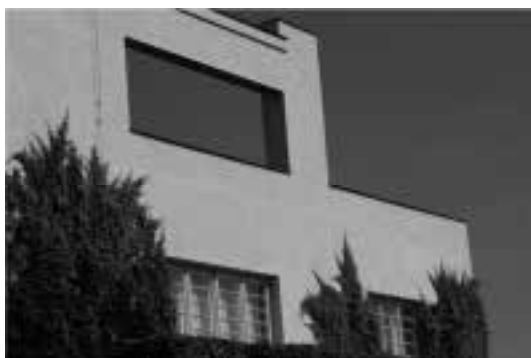
Ilustração 100 – Exterior Este da Villa Müller. (Susana Santos, 2010).