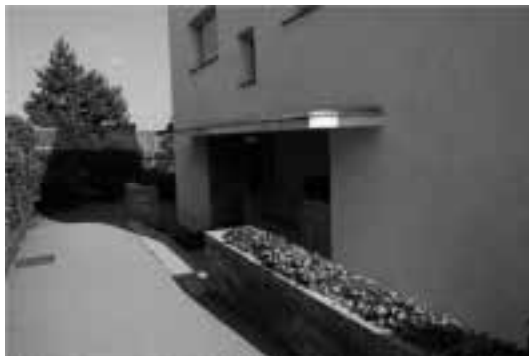
Ilustração 78 – Entrada da Villa Müller. (Susana Santos, 2010).

marcados e frondosos. Na aproximação por Sul, percebemos que a própria entrada da casa está rebaixada em relação à rua. Um plano superior horizontal e a subtração da matéria na fachada “engolem” a entrada na habitação.