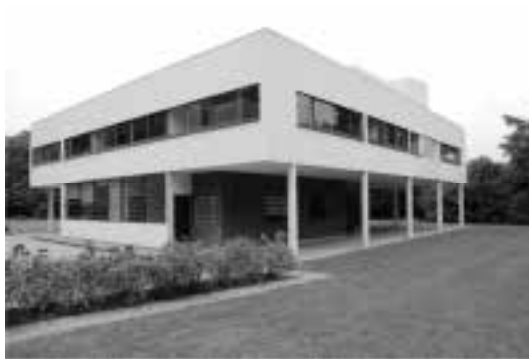
Ilustração 73 – Vistas exteriores da Villa Savoye. (Susana Santos,2010).