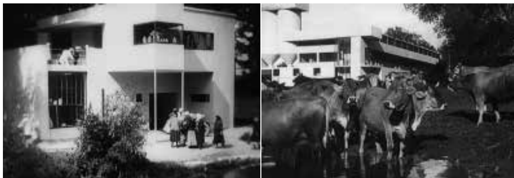
Ilustração 54 – Cenas de A Linha Geral . A cooperativa agrícola. Arquitectura de Burov. (Eisenstein, 2002b).

O terceiro momento, onde a máquina é fundamental para o desenrolar da narrativa, é relativa à cena da ceifa. Quando surge a máquina de ceifar, que é filmada em pleno trabalho, destronando os homens que fazem a ceifa manual. A máquina passa a fazer o trabalho do Homem. Reforçando a ideia, Eisenstein volta a referir, escrevendo no separador de texto, do próprio filme, “A Máquina” que “Ceifa a erva. Volteia o feno. E recolhe”.