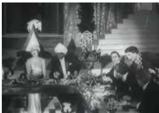
Ilustração 40 – Cena de L'Inhumaine . Sala de jantar de Claire Lescot. Cenografia de Alberto Cavalcanti. (L'Herbier, 1924).

A sala de jantar de Claire Lescot é elaborada com base numa geometrização do plano horizontal inferior, tanto ao nível da variação de cotas, como da padronização do seu desenho; esta geometrização preenche o espaço e é a essência do próprio espaço. No filme, a preto e branco, o contraste entre as formas geométricas pintadas de preto e de branco, relativas à sala de jantar de Claire Lescot , é preponderante. Deste modo falamos da visualização do espaço.