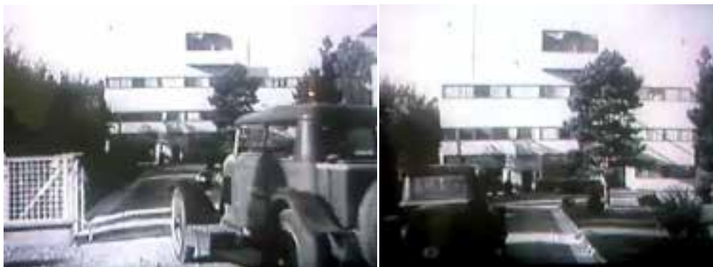
Ilustração 47 – Cenas de Architecture d'Aujourd'hui . Entrada na Villa Stein. (Chenal, [s.d.]).

Em Architecture d'Aujourd'hui , Le Corbusier direcciona a sua reflexão para a máquina, para a velocidade e para o movimento. A sequência de abertura do filme, demonstra que o movimento é um dos temas mais importantes da nova arquitectura. Arquitectura que se propõe, de certo modo cruza-se com uma das aquisições fundamentais do século: os meios de transportes. (Albretch, 1987, p.14). Estes temas relativos ao movimento e à velocidade são bastante caros a Le Corbusier; uma das primeiras sequências de abertura de Architecture d'Aujourd'hui é testemunha deste facto: o arquitecto actua como personagem principal, conduzindo o seu carro de um modo bastante activo até à entrada da Villa Stein, entrando, posteriormente, na casa, também, com muita determinação. (Colomina, 1996, p.289). Apesar de Le Corbusier não ser muito hábil a fazer televisão ou cinema – pois voltava-se sempre de costas para a câmara, não se relacionando de um modo directo com o público, resguardando, deste modo, a sua pose 56 –, ainda o podemos ver neste filme a explicitar a estrutura do Plano Voisin.