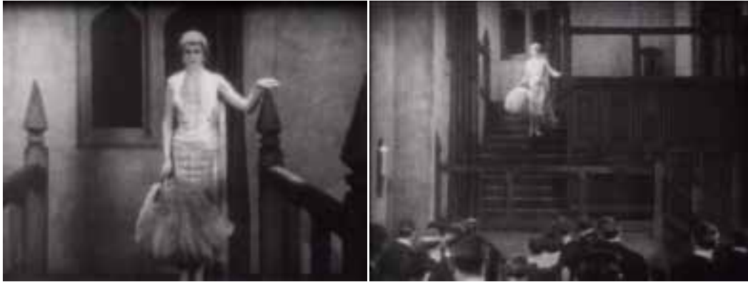
Ilustração 94 – Cenas de Easy Virtue . Sequência da descida de Larita . (Hitchcock, [s.d.]).