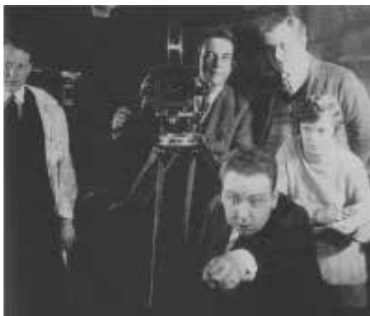
Ilustração 83 – Alfred Hitchcock em primeiro plano, na realização de Mountain Eagle (1926). (McGilligan, 2003, p.404.V).

Hitchcock foi influenciado por uma escola preocupada com a atmosfera, não tão atenta aos actores mas sim aos cenários, com todas as suas características e carácter. Escola esta que explora a fundo o jogo de sombras e luz, e os reflexos. De regresso a Londres, onde filmou The Lodger (1926) e Easy Virtue (1927) entre muitos outros, “(...) he grew equally attentive to Soviet film, and the theories of Dziga Vertov, (...) Sergei Eisenstein, and V. I. Pudovkin.” (McGilligan, 2003, p.75). Explorando a intensidade narrativa na montagem dos seus filmes, Hitchcock frequentemente quebra a acção e o espaço da narrativa, numa montagem muito característica, própria no seu modo de se expressar, muito fragmentada e focada nos detalhes, que culmina numa série de close-ups . (Jacobs, 2007, p.25).