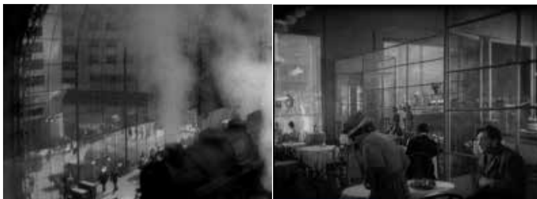
Ilustração 20 – Cenas de Sunrise . Tridimensionalidade potenciada pelos planos de vidro. (Murnau, 2006).

Outro dos exemplos que nos coloca perante a enfatização da tridimensionalidade da acção, centra-se na cena nocturna do parque de diversões. Um enorme plano de vidro separa o salão de dança da zona de jantar, que se encontra em primeiro plano. Nesta cena, por um lado, é enfatizada a ideia de transparência e, por outro, explicitada a profundidade de campo. As cenas passam-se sobrepostas: no primeiro plano, acompanhamos o desenrolar do jantar dos protagonistas; no plano de fundo, o baile acontece no seu ritmo de dança; entre os dois planos, uma cortina de vidro. A relação entre os vários planos cinematográficos enaltece o dinamismo e o movimento referente à acção, e a imagem deixa de ser rasa tornando-se tridimensional.