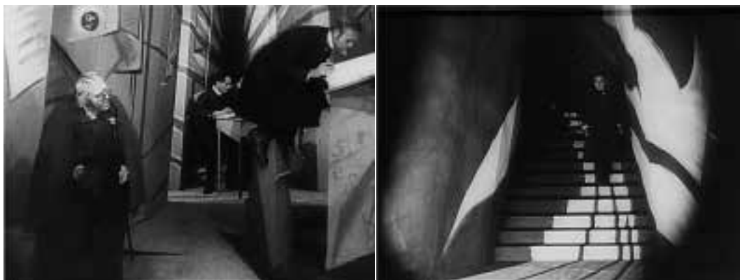
Ilustração 2 – Cenas de Das Cabinet Des Dr. Caligari . (Wiene, 2000).

Durante os anos 1920, esta capacidade associada à arquitectura – criação de um imaginário – vai-se desenvolvendo como um dos elementos fulcrais do cinema alemão. Nos filmes, Das Cabinet Des Dr. Caligari , de Wiene, ou Die Nibelungen e Metropolis de Fritz Lang, a arquitectura “(...) often assumed a malevolent presence, an oppressive force that ultimately destroyed its human protagonists.” (Bergfelder et al. , 2007, pp.111-112). Esta relação que o cinema alemão estabelece com a cenografia chega a ser obsessiva. Obsessiva no sentido da ênfase da arquitectura elevada à sua dramatização, ou seja, a arquitectura faz parte da narrativa, não simplesmente como pano de fundo mas, essencialmente, como um dos elementos fundamentais do enredo 13 .