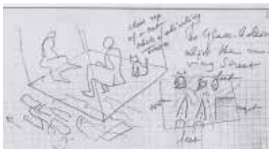
Ilustração 24 – Estudo de Eisenstein, para a realização de Glass House . (Eisenstein, 2009, p.18).

Eisenstein procura explorar, deste modo, a ideia de que, a matéria que nos envolve torna-se transparente, e, conseqüentemente, vai colocar as personagens em situações insólitas, como por exemplo no estudo que fez para uma varanda de vidro, colocada sobre o movimento intenso do tráfego da cidade (Eisenstein, 2009, p.18). Neste contexto, potencia a sensação de vertigem e de instabilidade, tal como prevê para um outro estudo onde desenha duas pessoas e um gato sentado num plano de vidro sobre o tráfego intenso da cidade. (Eisenstein, 2009, p.18).