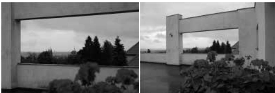
Ilustração 74 – Terraço da Villa Müller. Enquadramento. (Susana Santos, 2011).

Aqui, estamos na presença do enquadramento por excelência. Há uma relação pictórica com o que acontece exteriormente à habitação, e que aqui, no terraço, contrariamente ao enclausuramento que se vive na casa, somos levados para além dos limites físicos do espaço. Loos trás até nós o enquadramento perfeito. Ao fundo, na paisagem emoldurada, observam-se as torres do Castelo de Praga.