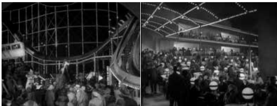
Ilustração 13 – Cenas de Sunrise: A song of two humans . (Murnau, 2006).

A cidade, como já foi referido, mostra-se luminosa quando filmada de dia, apresentando uma escala próxima do transeunte. Quando filmada durante a noite é uma cidade frenética. As luzes do parque de diversões cintilam, despertam o espectador, e é durante a noite que a cidade se revela. Murnau capta essa revelação.