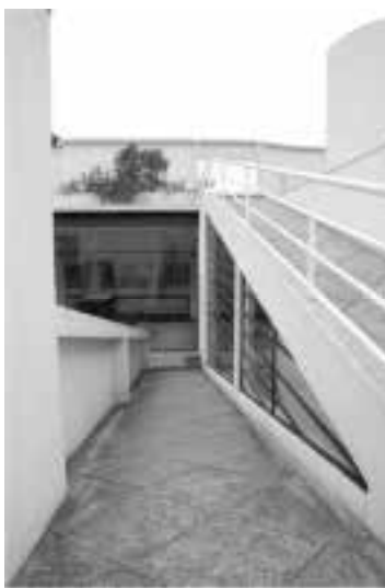
Ilustração 70 – Rampa de acesso ao solário. (Susana Santos, 2010).