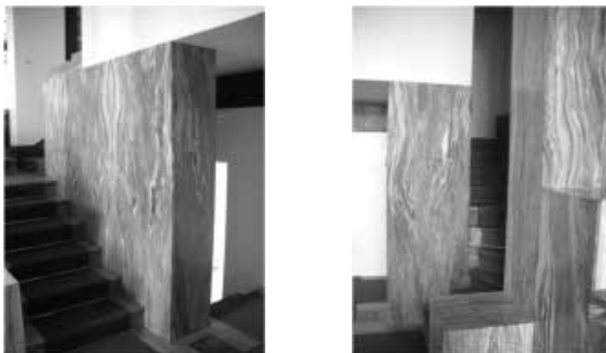
Ilustração 87 – Escadas que organizam o espaço em vários níveis. (Susana Santos, 2011).

O factor surpresa, a grandeza relativa do espaço, a ligação à escadaria central, a relação com a cota distinta da sala de jantar e o controle da luz, fazem do salão nobre um espaço com capacidade de nos emocionar.