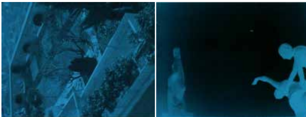
Ilustração 45 – Cenas finais de Les Mystères du Château du Dé . Rotação sobre um eixo. (Ray, 2007).

O movimento da câmara, que abarca o pátio, estabelece como que uma repetição dos fotogramas que reflectem a paisagem. Fotogramas estes, que reforçam a unidade da visão versus o movimento no cinema retratado através da arquitectura.