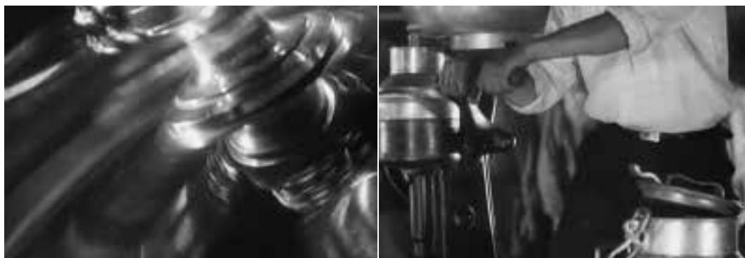
Ilustração 52 – Cenas de A Linha Geral . O movimento da desnatadeira. (Eisenstein, 2002b).

Um primeiro momento, quando os camponeses se encontram em redor de um objecto coberto por um pano, criando um certo suspense, e onde ao fundo, se vê Marfa a verter leite para um recipiente. A cena ganha valor quando o homem (o agrónomo local) destapa o objecto, surgindo então a desnatadeira. Eisenstein filma primeiramente a máquina no seu todo, depois, através do uso do grande plano, apercebemo-nos que Marfa entorna o leite para o seu interior. O agrónomo sugere a um dos camponeses que inicie o movimento do manípulo da máquina, surgindo escrito, no separador de texto do filme: “A Desnatadeira. Para poder fazer manteiga.”