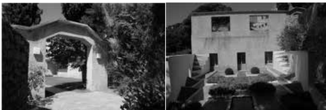
Ilustração 33 – Aproximação à Villa Noailles. (Susana Santos, 2009).

Em direcção à casa, à Villa Noailles, e desenganados da aparência provençal após a caminhada que nos leva à entrada da casa, deparamo-nos, surpreendentemente, com o amplo pátio circundado por planos verticais perfurados, que nos envolvem gentilmente no seu interior. É neste pátio, no seu interior, que somos confrontados com uma leitura inesperada da casa. A cobertura plana, as grandes janelas para o exterior, a leitura da continuidade das aberturas nas fachada e a composição dos sólidos geométricos, remetem-nos para um objecto arquitectónico francamente moderno.