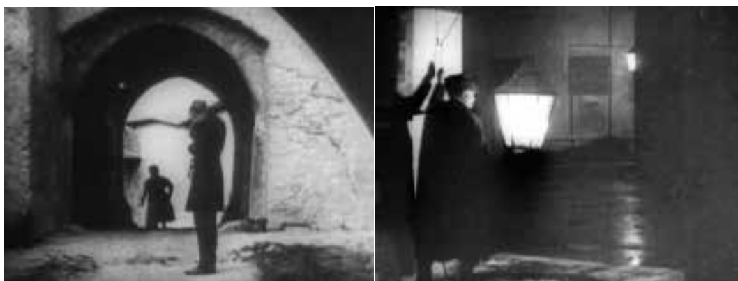
Ilustração 10 – Cenas de Nosferatu . (Murnau, 2010).

Apesar do filme de Murnau, Nosferatu, eine Symphonie des Grauens (1922), ser considerado um dos filmes menos expressionistas que realizou, no que se refere à sua relação com a luz (Biette, 1997, p.93), ao filmar, este filme de vampiros, com o qual se celebrou (Cousins, 2005, p.101), Murnau, utiliza a luz de um modo contundente por ter sido filmado no contraste inverso da sombra, que consequentemente aponta a luz.