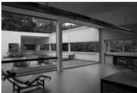
Ilustração 67 – Relação entre luz e sombra. (Susana Santos, 2010).

Voltamos com todo o cuidado ao pátio da Villa Savoye, onde, para além de activar a distribuição da luz para os compartimentos que o envolvem, de um modo contundente, marca, como referimos anteriormente, o enquadramento visual da envolvente que é privilegiado. Subimos ao solário por via da rampa.