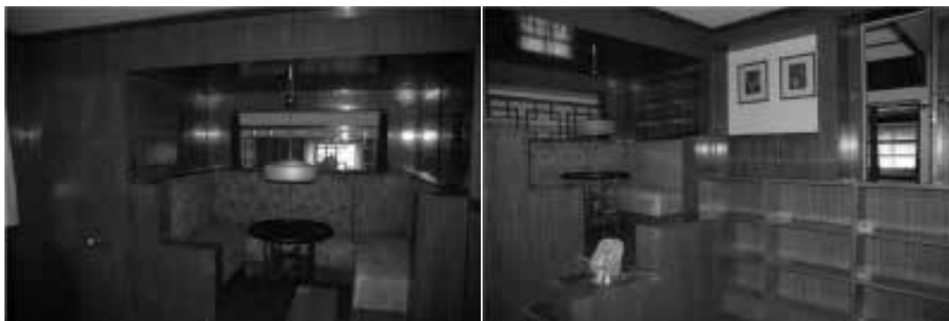
Ilustração 81 – Escritório de Milada Müller. (Susana Santos, 2011).

Um outro ambiente que vive da mesma relação espacial, e que distribui o espaço em várias cotas, é o escritório de Frantisek Müller. Na entrada do escritório, após descer quatro degraus que o separa do patim da escada principal, o espaço do escritório estabelece-se num só piso. Apresenta no entanto, dois pé-direitos diferentes, um na zona de estar e ler, e outro, na zona de escrever e projecção.