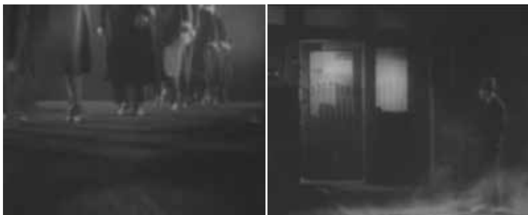
Ilustração 22 – Cenas de The Lodger . (Hitchcock, [s.d.]).

Para além da transparência aproximar os dois filmes – Sunrise e The Lodger: A Story of the London Fog –, a utilização de ambientes em nevoeiro, nos dois filmes, coloca em destaque de um modo particular, também, a translucidez ou mesmo a opacidade. Em Sunrise o nevoeiro acompanha a história em dois momentos fundamentais: no início do filme, na noite tornada cúmplice do encontro dos amantes; e no final do filme, também durante a noite, quando as várias personagens, dentro das embarcações, procuram, incessantemente, a mulher do protagonista. Busca esta, intensificada devido ao nevoeiro que se instala e que dificulta as buscas, fazendo aumentar o desespero das personagens. Em The Lodger: A Story of the London Fog , a palavra nevoeiro aparece no próprio título do filme, oferecendo um sinal relativo ao drama da narrativa. Em The Lodger , o assassino poder esconder-se nos becos e nevoeiro da cidade. A cidade de Londres, ela própria tipicamente conotada com o nevoeiro 35 .