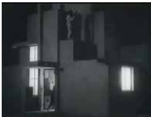
Ilustração 30 – Cena de L'Inhumaine . Exterior da casa de Einar Norsen, cenografia de Mallet-Stevens. (L'Herbier, 1924).

No entanto, outras questões também relevantes caracterizam esta mesma interligação. Como exemplo, o facto da entrada da Villa Noailles se encontrar a uma cota mais elevada que a cota do pátio onde se situa. Os três degraus que marcam a entrada, projectam a porta da entrada para uma situação de destaque face à fachada da Villa. O mesmo acontece com a casa de Claire Lescot em L'Inhumaine . Deste modo, ao criar alguns degraus e afastar a casa do chão, Mallet-Stevens valoriza a posição do corpo face à entrada na habitação – essa diferença de cota, face ao plano onde circulam os carros, facilita a leitura das personagens que compõem o enquadramento.