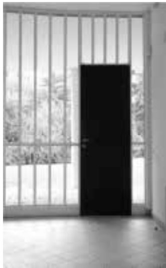
Ilustração 72 – Entrada lateral. Villa Savoye. (Susana Santos, 2010).