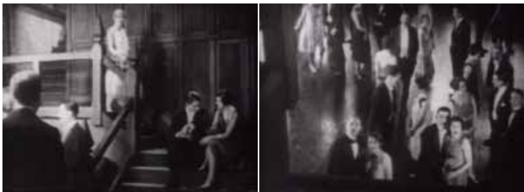
Ilustração 96 – Cenas de Easy Virtue . Sequência da descida de Larita . (Hitchcock, [s.d.]).