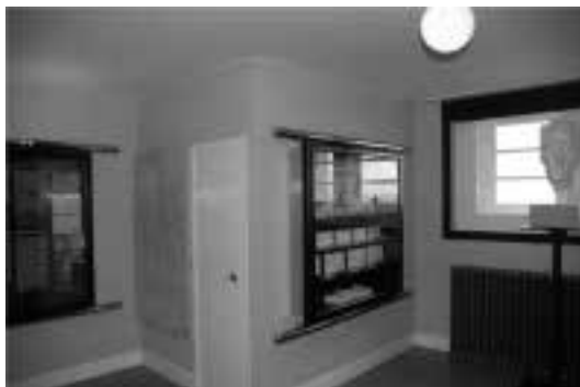
Ilustração 77 – Sala fotográfica com câmara escura.

constante questão para Loos, pois o facto do espaço exterior social da casa estar remetido para o terraço, ou seja, o mais afastado possível da rua e dos olhares alheios, corresponde à intencionalidade descrita de Loos de recolher para a intimidade familiar os actos próprios da vida privada da família.