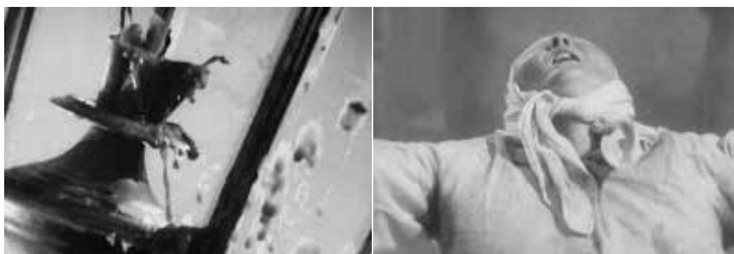
Ilustração 71 – Cenas de A Linha Geral . Grandes planos na sequência da procissão. (Eisenstein, 2002b).

Em A Linha Geral , na cena da procissão religiosa, Eisenstein faz deslizar a câmara horizontalmente até que esta pára, realizando uma série retratos em grande plano “(...) isolating peasants as they press their faces to the ground in hope and humility, and the montage tempo quickens as gusts of wind blow across the parched soil.” (Goodwin, 1993, p.107).