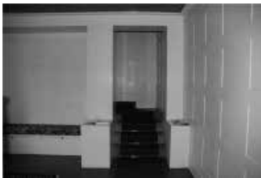
Ilustração 86 – Hall de Entrada da Villa Müller. (Susana Santos, 2011).

Na Villa Müller, passamos a porta da entrada e encontramos-nos dentro da habitação. O espaço é escuro, sem luz natural, as paredes são revestidas a painéis cerâmicos verde-esmeralda, cor muito profunda que acentua a densidade do espaço. Encontramo-nos num corredor que nos direcciona para o hall da entrada. Desaguamos, então, no hall de entrada bastante luminoso e claro. Na sala branca, devido à cor e à luz intensas, a uma cota mais baixa, que a do salão nobre que estruturalmente se segue, e mais baixa, também, que a própria rua – alheios de toda a estrutura espacial da habitação –, somos convidados a fazer a subida para a parte nobre da casa através de uma escada estreita que, inicialmente, roda sobre si própria, colocando-nos sobre a abertura do grande salão.