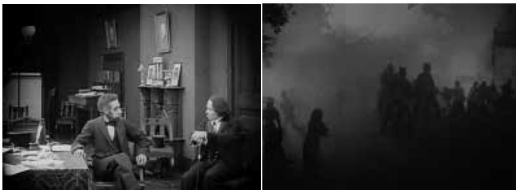
Ilustração 6 – Cenas de The Birth of a Nation . (Griffith, 2000).

À sombra dos lucros de The Birth of a Nation , Griffith vai realizar Intolerance em 1916, “(...) cuja montagem no tempo e no espaço se tornaram uma concepção mundial. Este filme louco conheceu um tremendo fracasso comercial, mas as suas pesquisas abriram largas perspectivas.” (Sadoul, 1993, p.125). O filme Intolerance foi apresentado na Europa e foi importado para a Rússia em 1916, mas devido à sua complexidade, não foi bem recebido, ficando a sua estreia marcada somente, para Novembro de 1918 em S. Petersburgo. (Geada, 1998, p.84). Apesar deste desfazimento no tempo, as críticas consideraram-no, tecnicamente, como um modelo de perfeição.