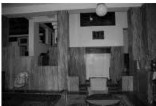
Ilustração 88 – Relação entre os vários níveis da Villa Müller. (Susana Santos, 2011).

Como refere Jacobs, em relação ao cinema de Hitchcock, o momento de entrada em cena, consubstanciado na qualidade do espaço arquitectónico do cenário, é fundamental no acto de surpreender o espectador. Do mesmo modo, o momento de surpresa ao entrar no salão da Villa Müller, gera uma carga cénica, reportada ao acto de entrar, efectivamente, em cena, e o filme começa a rodar. O raumplan de Loos evidencia-se.