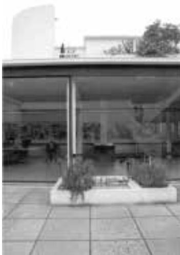
Ilustração 61 – Pátio da Villa Savoye. Focando direcção Oeste. (Susana Santos, 2011).

Olhamos para Oeste, colocamo-nos em frente à sala e olhamos esta, mais longe olhamos, também, as árvores através das janelas da sala, parece esclarecer-se a profundidade de campo na sobreposição dos planos.