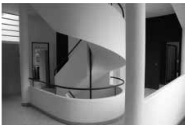
Ilustração 63 – Escada que percorre todos os níveis da Villa Savoye. (Susana Santos, 2010).

É o próprio Le Corbusier que qualifica: "Cette vis, organe vertical pur, s'insère librement dans la composition horizontale." (Le Corbusier, 1960, p.138).