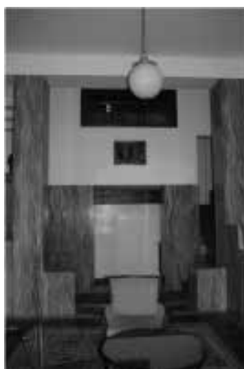
Ilustração 89 – Tripartição do espaço relativo ao salão. (Susana Santos, 2011).