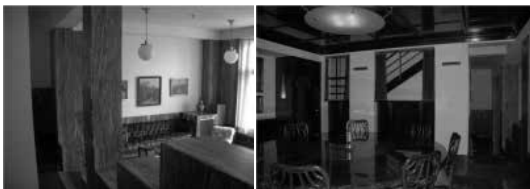
Ilustração 90 – Sala de jantar e perspectiva da sala de jantar para o salão. (Susana Santos, 2011).

O sentido cénico da casa pode, também estabelecer-se através da visão promovida entre a sala de jantar e o salão, pois este põe em evidência a relação entre o ser observador, o ser observado e o que se observa. Contrariamente ao salão, que tem o tecto pintado de branco e que abre o espaço, a sala de jantar tem o tecto em madeira de mogno que intensifica a compressão do espaço e lhe confere um carácter mais íntimo, acentuando a ideia de estarmos na retaguarda do lugar onde decorre a acção principal.