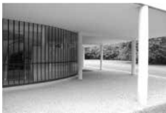
Ilustração 65 – Pilotis da Villa Savoye. (Susana Santos, 2010).

Uma “armadilha” para o sol. Le Corbusier, não só compõe com a luz, como torna-a refém do seu trabalho – o sol percorre a casa livremente, inundando-a. A ideia de “armadilha”, reforça o sentido em que a casa atrai o sol, não o sentido do sol ser seu prisioneiro. Na Villa Savoye, a luz é atraída, “(...) l’air circule partout, la lumière est en chaque point, pénètre partout.” (Le Corbusier, 1960, p.138).