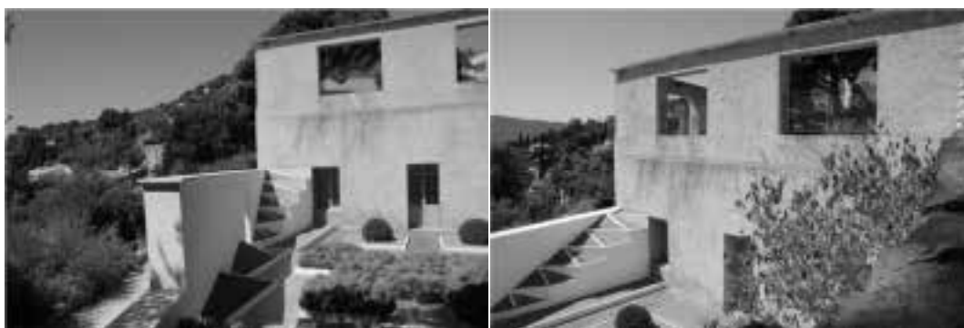
Ilustração 29 – Exterior da Villa Noailles.

Em 1923, no mesmo ano em que recebe o convite dos Viscondes de Noailles para projectar a Villa Noailles, como já foi referido, recebe também, a proposta de Marcel L'Herbier para participar na construção dos cenários de L'Inhumaine . No cruzamento da experimentação cenográfica com a construção da Villa Noailles, Mallet-Stevens potencia a sua experiência de projecto e afere sistemas de relações entre os dois ofícios.