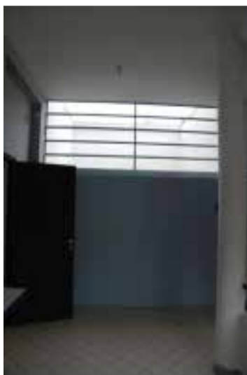
Ilustração 58 – Plano vertical pintado de azul. (Susana Santos, 2010).

através da abertura superior da parede pintada de azul celeste. Assola-nos a concordância entre os dois azuis. O azul do céu e o azul da parede. Mesclam-se as cores e acentua-se a profundidade. Percebemos que se enfatiza a relação entre o interior e o exterior da casa, por meio da simbiose da cor azul – escolhida por Le Corbusier para pintar o plano vertical –, e a cor azul do próprio céu.