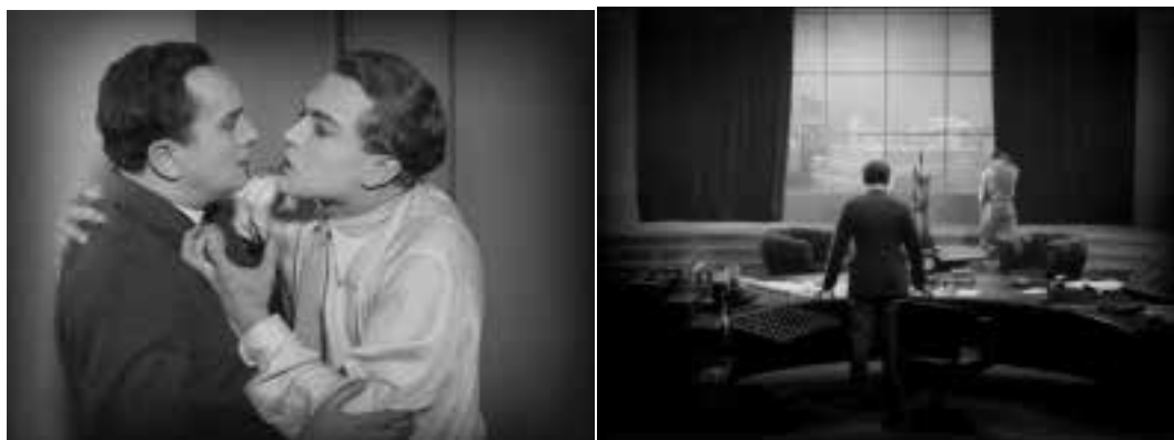
Ilustração 14 – Cenas de Metropolis . Caracterização das personagens e do espaço. (Lang, 2008).

Neste sentido, os actores e o espaço caracterizados pela luz, são ambos personagens da acção. Mediante o efeito e a ênfase que o trabalho da luz consegue produzir em estúdio, o realizador consegue estabelecer uma consequência directa entre o filme e os espectadores apoiada na emoção que atravessa o ecrã e que é absorvida pela assistência. Também em Metropolis é trabalhada a dicotomia – desta vez entre a cidade rica e a cidade pobre e subterrânea, que sustenta a grande metrópole. A luz numa é franca, e na cidade subterrânea é enclausurada.