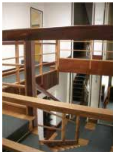
Ilustração 80 – Escada principal. Ao fundo observa-se a escada de serviço. (Susana Santos, 2011).

No centro deste movimento, inscreve-se o escritório de Milada Müller. Um espaço muito concentrado, onde as escadas têm um papel fundamental na qualificação e na divisão das várias zonas, não havendo desperdício de espaço.