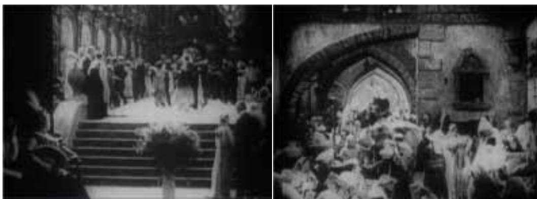
Ilustração 7 – Cenas da primeira e segunda histórias de Intolerance . (Griffith, 2006).

À sombra dos lucros de The Birth of a Nation , Griffith vai realizar Intolerance em 1916, “(...) cuja montagem no tempo e no espaço se tornaram uma concepção mundial. Este filme louco conheceu um tremendo fracasso comercial, mas as suas pesquisas abriram largas perspectivas.” (Sadoul, 1993, p.125). O filme Intolerance foi apresentado na Europa e foi importado para a Rússia em 1916, mas devido à sua complexidade, não foi bem recebido, ficando a sua estreia marcada somente, para Novembro de 1918 em S. Petersburgo. (Geada, 1998, p.84). Apesar deste desfazimento no tempo, as críticas consideraram-no, tecnicamente, como um modelo de perfeição.