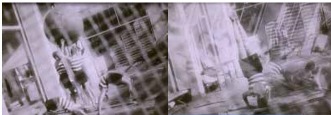
Ilustração 43 – Cenas de Les Mystères du Château du Dé . Sobreposição de fotogramas. (Ray, 2007).

Marcel L’Herbier já tinha usado as sobreposições em L’Inhumaine . Estas aparecem de um modo muito veemente, nas cenas finais do filme quando Einar Norsen tenta voltar a dar a vida à sua amada, Clair Lescot . De tal modo esta cena é importante no filme que, após a estreia de L’Inhumaine , Adolf Loos comenta-a: “C’est une chanson éclante sur la grandeur de la technique moderne. (...) La réalisation des dernières images de L’Inhumaine dépasse l’imagination. En sortante de la voir, on a l’impression d’avoir vécu l’heure de la naissance d’un nouvel art.” (Loos apud L’Herbier, 1979, p.105).