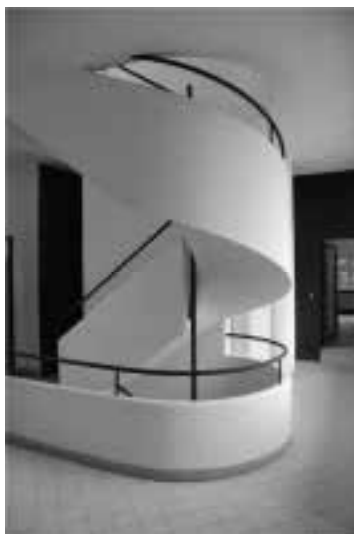
Ilustração 64 – Escada que percorre todos os níveis da Villa Savoye. (Susana Santos, 2010).