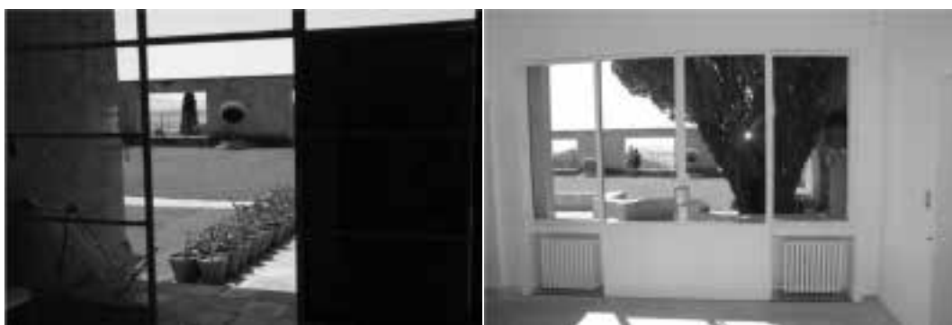
Ilustração 38 – Interiores da Villa Noailles. Relação espacial e visual com o pátio. (Susana Santos, 2009).

Já no interior da Villa, desenvolve-se uma sequência espacial de carácter mais tradicional. Os quartos sucedem-se uns aos outros e o corredor que os liga estabelece o seu encadeamento. Os quartos têm vista privilegiada para o pátio e, através das