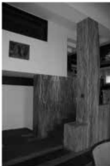
Ilustração 97 – Entrada para o salão e janela do escritório de Milada Müller. (Susana Santos, 2011).

“A window looks down from this room into the main room so that the lady of the house can observe those arriving without herself being noticed.” (Loos, 2011,p.37). Deste mesmo modo, o facto de a sala de jantar estar envolta em cortinas penduradas nos vãos que a separam da escadaria, confere ao espaço a mesma leitura de protecção e de intimidade. O abrir e fechar das cortinas promove, o espreitar ou o abrir, do espaço contíguo.