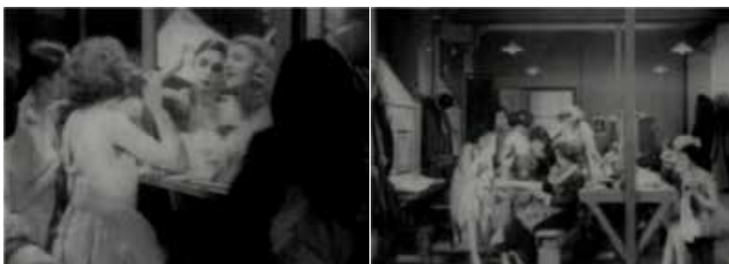
Ilustração 1 – Cenas de The Lodger . (Hitchcock, [s.d.]).

Esta movimentação da câmara sobre o local da acção tem consequências na construção do próprio cenário. Consequentemente, este movimento vai também libertar os actores no seu próprio movimento cénico. O realizador tem de dimensionar o cenário de forma a poder movimentar a câmara e os actores livremente sobre o espaço sem impedimentos – projecta, deste modo, a trajectória da câmara. O lugar torna-se cinético, e o movimento dos actores reporta-se à acção relativa ao espaço arquitectónico. Deste modo, o cenário deixa de ser bidimensional evoluindo a partir daí para a construção do “lugar arquitectónico” – ao mesmo tempo que a técnica inglesa define o espaço. O movimento da câmara “(...) create linear, architectonic movement, since they use literal track (lines) across space.” (Tashiro apud Bergfelder et al. , 2007, p.267).