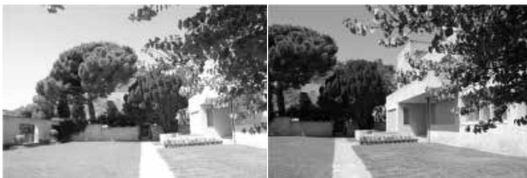
Ilustração 34 – Entrada na Villa Noailles. (Susana Santos, 2009).