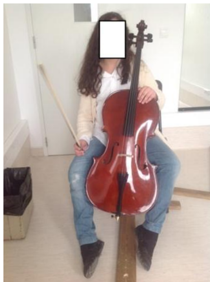
Ilustração 5 - Posição barroca. (Ilustração nossa, 2014)

Na linha de pensamento de Lynn Harrel (Sweeney, 2008a) é fundamental a utilização correcta do tamanho do espigão e da colocação do violoncelo entre os joelhos de forma a ter a gravidade e peso ideal. Não é habitual ver-se alunos a colocar demasiado espigão, pelo contrário, é sim habitual ver-se a utilização de pouco espigão. A escolha do tamanho do espigão em função do tamanho do violoncelista e da cadeira é fundamental porque determina a funcionalidade plena dos movimentos.