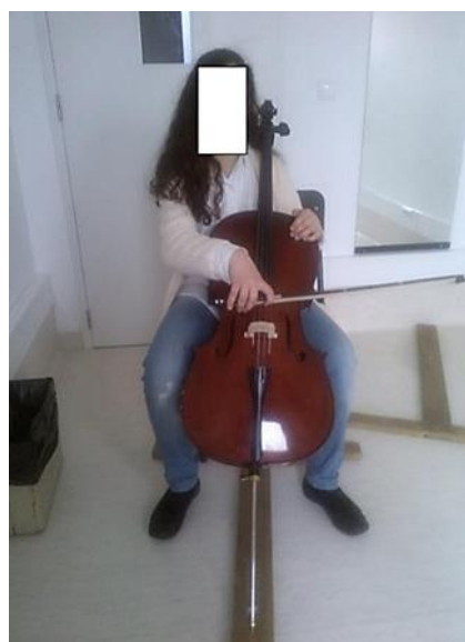
Ilustração 4 - Posição incorrecta. (Ilustração nossa, 2014)

A aluna coloca o violoncelo demasiado perto do ombro, provocando a descida do cotovelo da mão esquerda, isto deve-se ao facto da aluna colocar uma quantidade de espigão excessiva, fazendo com que o violoncelo fique deitado. Devido à colocação do violoncelo demasiado deitado, a coluna fica inclinada para trás o que retira o equilíbrio normal do corpo e todo movimento natural à mão esquerda, principalmente quando tiver de mudar de posição, retira também liberdade à mão direita, deixando-a bloqueada.