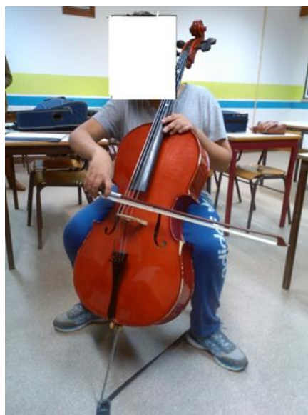
Ilustração 6 - Posição incorrecta. (Ilustração nossa, 2014)

Para este caso, como já sugerido noutras situações idênticas, pode-se pedir ao aluno que imagine estar a olhar para o cimo de uma montanha ou simplesmente o professor nas aulas pode segurar na cabeça do aluno, impedindo o mesmo de olhar para baixo.