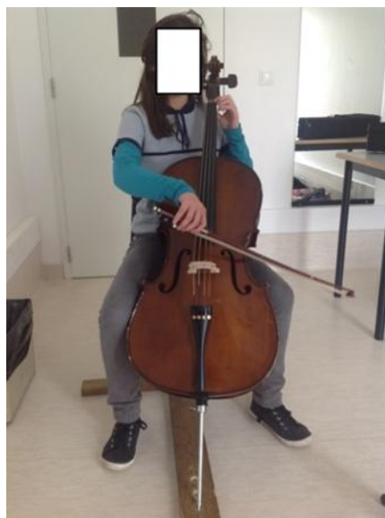
Ilustração 3 - Posição correcta. (Ilustração nossa, 2014)

Observa-se a má colocação da mão esquerda, neste caso o posicionamento do polegar incorrectamente atrás do primeiro dedo, em vez de ser colocado entre o primeiro e segundo dedo, o que provoca tensão e uma pior afinação. A aluna quando coloca o primeiro dedo sobre a corda faz com que os restantes dedos fiquem demasiado longe da mesma, o que dificulta na agilidade técnica e na afinação, uma vez que os dedos ao estarem demasiado afastados da corda é aumentada a probabilidade de a afinação não ser tão eficiente do que se tivermos os dedos perto da mesma.