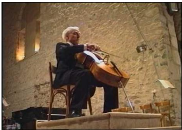
Ilustração 1 - Espigão curvado / Paul Tortelier. (Vaimusic, 2009)