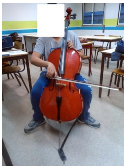
Ilustração 7- Posição correcta. (Ilustração nossa, 2014)

O aluno coloca o cotovelo excessivamente alto, o que o obriga a trabalhar demasiado com o pulso nas mudanças de corda, e retira todo o peso do braço principalmente no talão o que prejudica a qualidade do som. O aluno deve utilizar a altura adequada do cotovelo a cada corda, na corda mais aguda (lá) o cotovelo mais alto do que na corda mais grave (dó) onde tem de estar mais baixo.