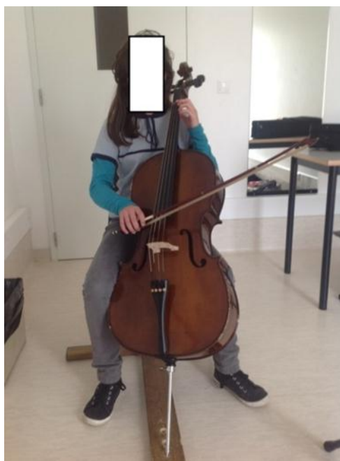
Ilustração 2 - Posição incorrecta. (Ilustração nossa, 2014)

A aluna inclina o corpo para baixo porque existe a tendência de olhar para a mão direita, o que provoca a inclinação da cabeça na direcção do chão. A longo prazo este problema pode causar lesões na coluna e o mais provável é que possa existir no futuro problemas na coluna cervical. Deve-se incentivar a olhar para frente, solicitando como exercício que imagine estar a olhar para o cimo de uma montanha, o que normalmente tem um resultado imediato.